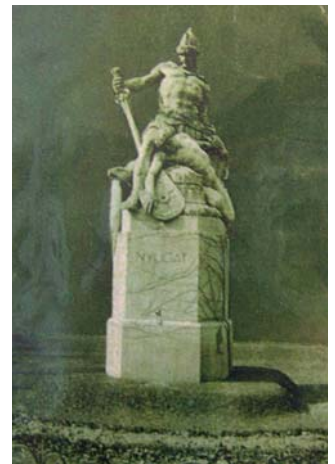
A Szabadság téren egykor állt négy trianoni szobor az elcsatolt területeknek égtájként (Észak, Kelet, Dél, Nyugat – balról jobbra) állított emléket