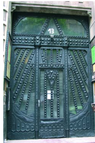
Falk Miksa utca 13. kapuja

lépve márványlépcső vezet fel és a falakat mindkét oldalon szimbolikus domborművek díszítik (zenélő és olvasó nő mellékalakokkal). A szobrászati munkák Lányi Dezső és Vass Viktor munkái. A megmaradt ólombetétes lépcsőházi ablakok valószínűleg Róth Miksa műhelyében készültek. A tágas belső udvar oszlopcsnakos, ahol a jugendstílus elemeit láthatjuk.