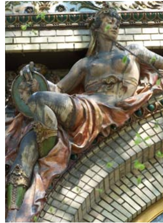
Elődeink mives munkája

Thaly Tibor leírásában a kortársak azon véleményét is jelzi, miszerint a Pfaff a magyar stílust kereste volna az épület megalkotásakor. Véleménye szerint a kérdés feltevését a Zsolnay gyár, később méltán híressé vált majolika termékei még ekkor nem igazolhatták. Nem vitatható azonban az a tény,