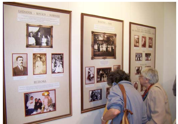
A Pestújhelyi Pátria Egyesület támogatásával készült archív fotókiállítás (Képeink a falról – pestújhelyi generációk)