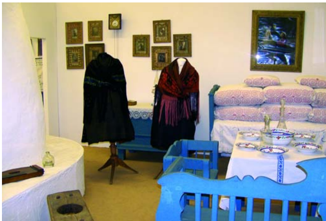
Palotai enteriőr (20. század eleje)

Helytörténeti táruk a legkülönbözőbb település-, intézmény- és családtörténeti dokumentumokból, térképekből, tervekből, fényképekből, képeslapokból, magnetofon-kazettákból, videofilmekből áll.