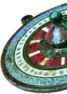
Emailos koro (ruha kapcsoló) máncos – Kr.

Az intézmény a – gazdasági válság ellenére – a 2009. év folyamán ismét közel 40 régészeti ásatást és megfigyelést végzett beruházásokhoz kapcsolódóan a főváros területén. Ezek közül kiemelkedik az MO