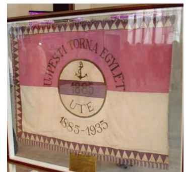
Az egylet zászlója (1935)