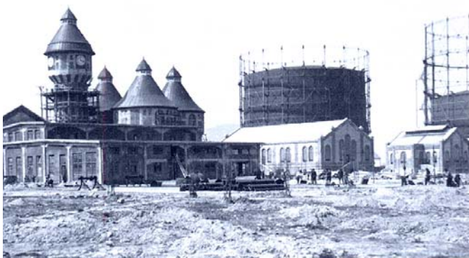
Az óbudai gázugár építése

Budapest közműellátásának változásáról a legfrissebb forrás talán Vadas Ferenc Gázugárak és villanytelepek Budapesten című tanulmánya, amely az óbudai gázugár történetével is foglalkozik.