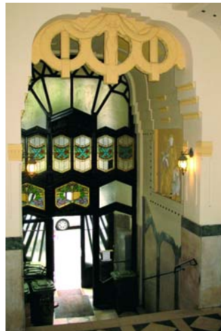
Falk Miksa u. 13. belső kapuja