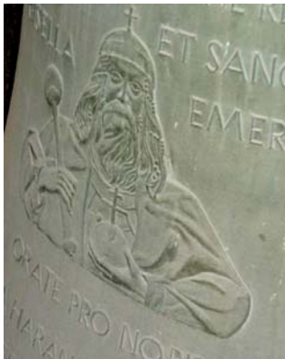
Szent István dombormű a harangon