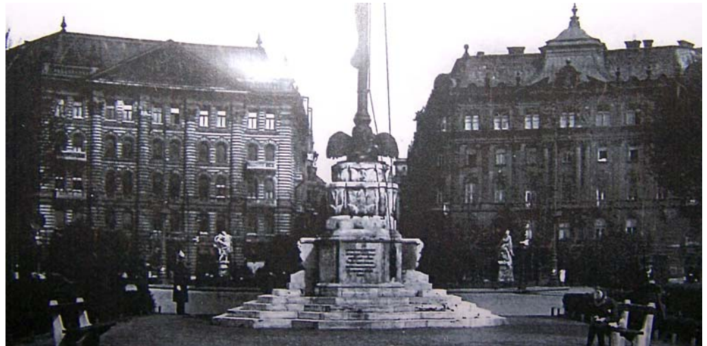
A Szabadság téren egykor a Trianoni Országzászló állt (A fotók Sebestyén Imre kecskeméti képeslap gyűjteményéből valók.)

lomokban ma délelőtt megkondultak a harangok, a gyártelepek megszólaltatták szirénáikat és a borongós őszi levegőben tovahepölygő szomorú hanghullámok a nemzeti összeomlás fájdalmas gyászát jelentették... Ma tehát elszakították