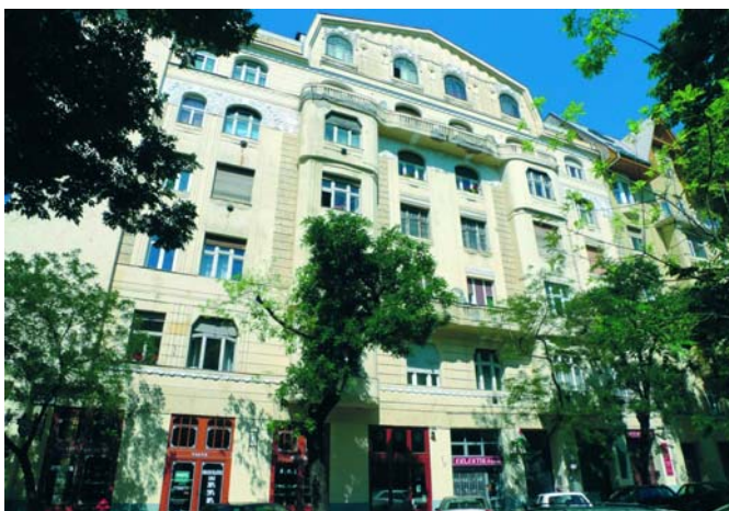
Az Atlantica ház