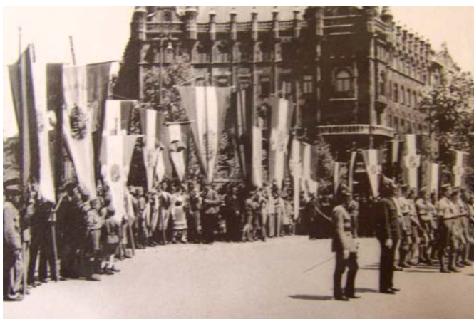
A vidéki országzászlókat a Szabadság téren avatták és szentelték fel

A Magyar Királyság megcsönkítése több évszázad történéseinek eredőjeként következett be. Legfőbb oka a Kárpát medence etnikai összetételének megváltozása volt. A másfél évszázados török hódoltság és a vele párhuzamosan alakuló Habsburg hódítás a magyar népesség drasztikus fogyását eredményezte, az itt élő nemzetiségekhez viszonyít-