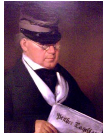
Weber Henrik: Férfi arckép, 1840-es évek (Vászon, olaj)

Tárlatuk egy jellemzően 19. századi jelenség, Pest-Buda nagyvárossá válása során létrejövő társadalmi csoport, a polgárság fontosabb társadalomtörténeti jellemzőjét mutatja be. Ugyanakkor azonban nagy hangsúlyt fektet, hogy ezt konkrét személyek életútján keresztül vázolja fel, ezzel is közelebb hozva a látogatóhoz a 19. századi városok polgárainak életvilágát.