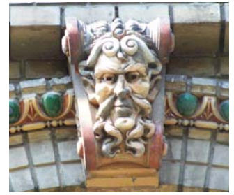
A színes mázas kerámia időállónak bizonyult

hogy a Zsolnay kerámia teremtette meg az alapjait a magyar stílusnak.