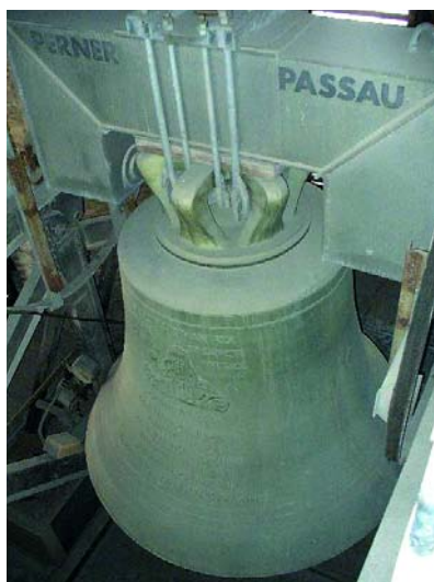
Magyarország legnagyobb tömegű harangja a Szent István harang

indultak. Fél év alatt készült el hatástanulmányuk és marketing tervük. Az uniós pályázaton nyert 19 millió forint és Óbuda önkormányzatának támogatása tette lehetővé a kiállítás létrehozását. (Folytatása a 9. oldalon.)