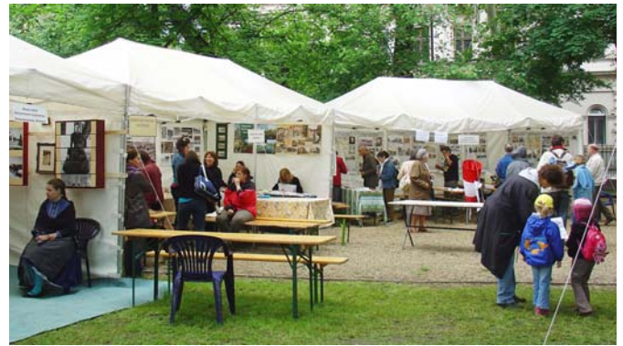
A fővárosi kerületek gyűjteményeinek sátrai