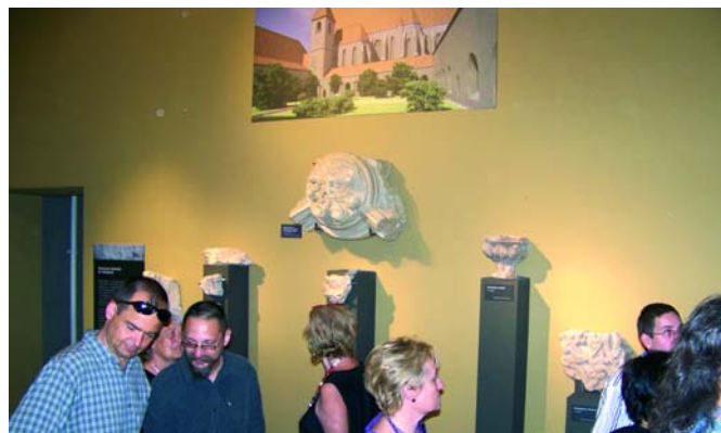
Az állandó kiállítás egyik középkori terme