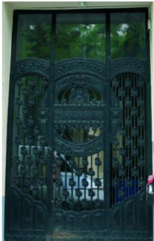
Az Atlantica ház kapuja

A képzőművészeti antikváriumairól, galériáiról, stúdióiról híres pesti utcát száz éve nevezték el Falk Miksáról (1828–1908), a magyar újságírás nagytekintélyű alakjáról, a Széchenyi köréhez tartozott akadémikusról, aki Erzsébet királyné nyelvtanára is volt. (Munkáiból két címet említek: Széchenyi István gróf kora, 1868; Korés jellemképek, 1902.)