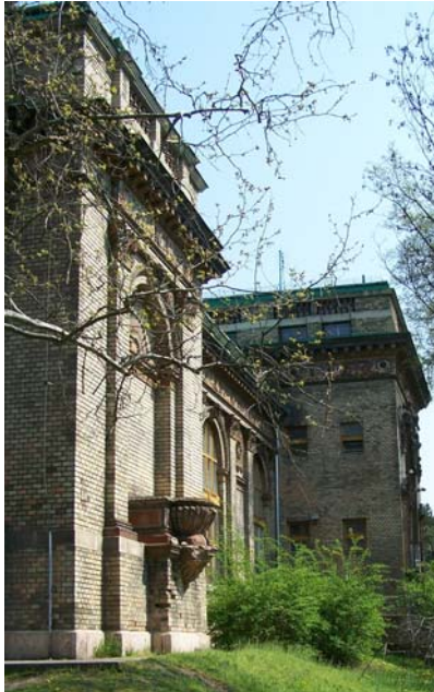
A „Palme-ház” – a régi Múcsarnok

ként bemutatta az ország fejlődését a nagyvilágnak. Ez a városligeti esemény az egyesített főváros első, látványos programja volt. A rendezvény – mai nemzetközi nevén az expo – eredendően nem csak a bemutatást és bemutatkozást szolgálta, hanem a jövő fejlődésének zálogaként is szolgált. Itt találhattak egymásra a partnervállalkozók, hazaiak és külföldiek egyaránt. Ezáltal nyert piacot magának a fejlődő „honi” ipar és kereskedelem.