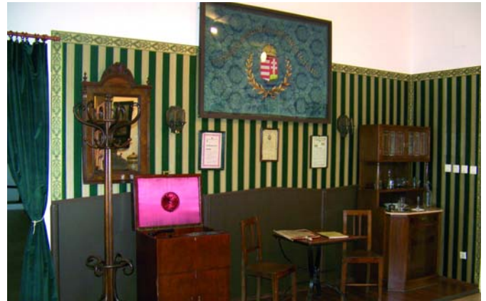
A civil élet pestújhelyi relikviái (20. század eleje)

Múzeumuk a néprajzi tárgyak (viselet, bútorkészlet, kerámia) és paraszti, mezőgaz-