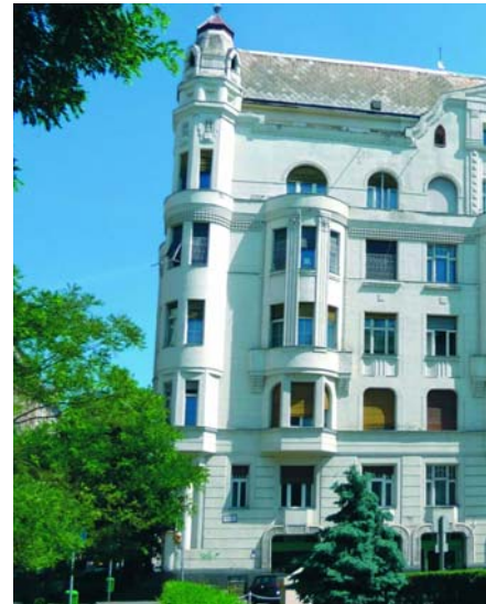
A Falk Miksa u. 13. homlokzata