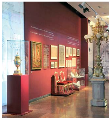
Az állandó kiállítás egyik enteriőrje

Az épület történetének végigkövetése során a barokk épületmágtól elindulva meg-