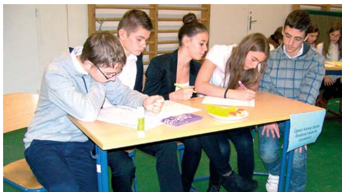
A vetélkedő győztes csapatának tagjai az Újpesti Károlyi István Általános Iskola és Gimnázium diákjai

ten Oktató Általános Iskola valósíthatta meg a versenyt. (Az intézmény névadója az UTE kiváló olimpikonja, úszó és vízilabdázó sportembere). Vetélkedőjükre kilenc általános iskolai csapat ne-