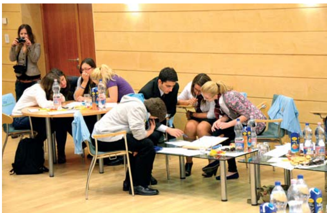
Feladatmegoldás a döntő termék egyik...

2013. november 18-i döntőbe jutott 10 legjobb csapat tagjait Csomós Miklós főpolgármester-helyettes köszöntötte a helyszínen, Budapest Főváros Levéltárában. A résztvevők azután izgalmas versenyt vívtak, felhasználva a főváros történetével kapcsolatban az első két fordulóban megszerzett ismereteiket is. Kvíz játék keretében, igaz és hamis állítások között kellett a versenyzőknek eligazodniuk, teszt lapokat kitölteniük, épületképeket felismerniük.