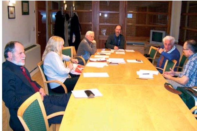
Gondterhelt arcok az elnökségi ülésen az egyesület anyagi háttere miatt

4. számát. Elkészítették a fővárosi helytörténeti oktatás helyzetével foglalkozó 2014. évi tavaszi tudományos konferenciát – megrendezése