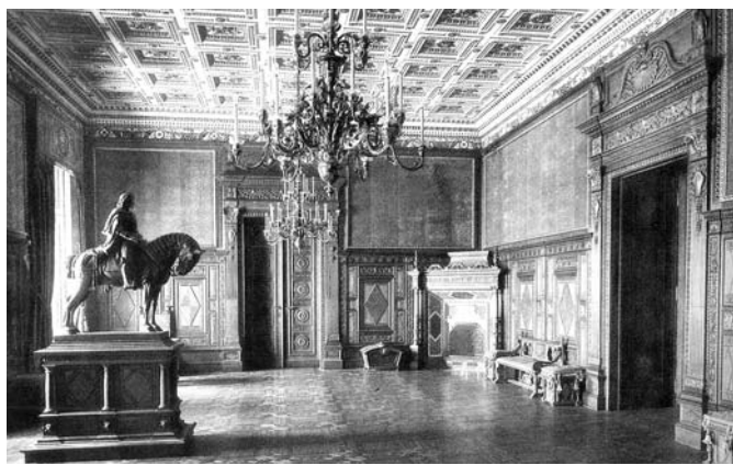
A Hunyadi Mátyás terem 1912-ből származó fotója – archív felvétel

és díszes használati tárgyak segítségével. A kiállításon a műtárgyak mellett több 3D-s animáció is segíti a palota építési fázisainak megismerését, érintőképernyőkön virtuálisan bejárhatók a palota elpusztult termei, továbbá digitális képernyőken bemutatott korabeli fotók és tervek, illetve múzeumpedagógiai állomások is várják a látogatókat.