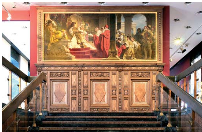
A Hunyadi terem falrekonstrukciója Benczúr Gyula Mátyás királyt bemutató festményével

rabeli, fehér-arany festésű, gazdagon díszített keretben karmazsinvörös selyemdamaszt bevonatú falrészlet, amelynek textilborítása a bécsi Hofburgban őrzött eredeti pontos másolata. A másik a neoreneszánsz Hunyadi