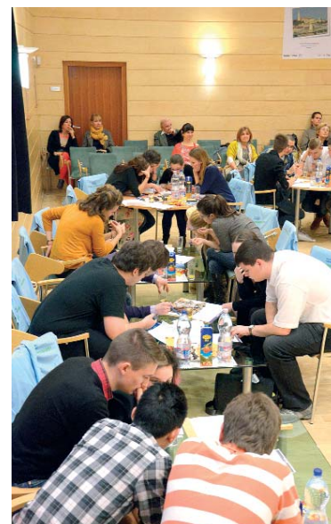
... és másik oldalán

A verseny győztesévé a Kölcsey Ferenc Gimnázium „Éjjel-nappal Budapest” csapata vált. A második helyezett a Gundel Károly Vendéglátóipari és Idegenforgalmi Szakképző Iskola „PestreFel” csapata, a harmadik helyezett pedig a Nemes Nagy Ágnes Művészeti Szakközépiskola „Klotild főhercegnő” csapata lett. A verseny első három helyezett csapatának tagjai a fejenként 25 ezer, 20 ezer, illetve 15 ezer forintos jutalmak mellett résztvevői lehetnek a Fővárosi Önkormányzat 2014. évi nyári