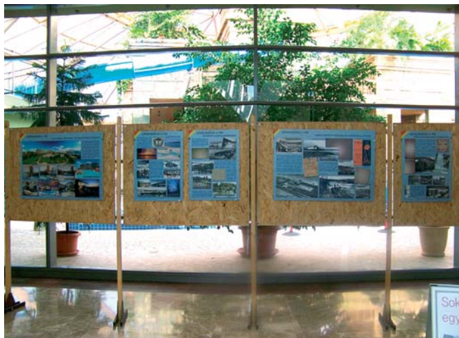
A tárlat vándorkiállításaként az Aquaworld Budapestet is megjárta