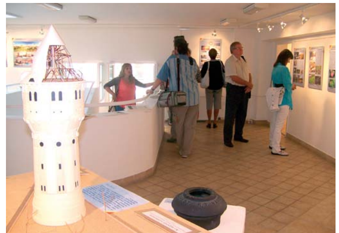
Száz éve épült ki Újpest önálló vízellátása