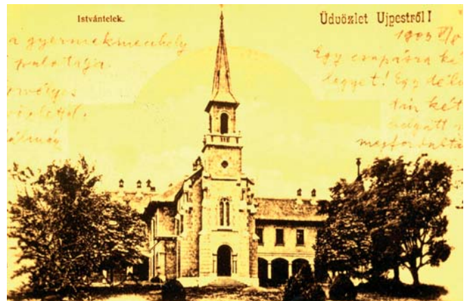
Képeslap a Clarisseum templomáról – 1900 körül

Egy újpesti helytörténeti kiadványban olvassuk, (1996) amelyek Újpest templom-épületeit veszik számba, hogy az Egek Ki-