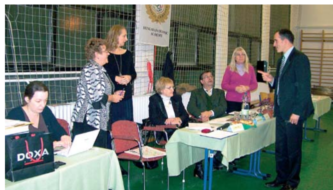
A zsűri tagjai és a vetélkedő előkészítői döntő előtti megbeszélése

Megnyerték egyben a lehetőséget, hogy iskolájuk, a Károlyi Gimnázium szervez-