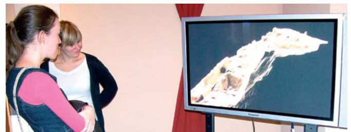
A felfedezések eredményeit 3D-s film ismertette

együtt élnek, minél távolabbra tudunk tekinteni a múltban, annál jobban látjuk a jövőt – mondta.