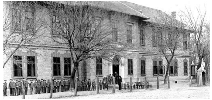
A Clarisseum nevelőotthona és a szaléziak nevelte gyermekek az 1930-as évek végén

Ybl Ervin – Ybl Miklós unokaöccséről szóló – művé-