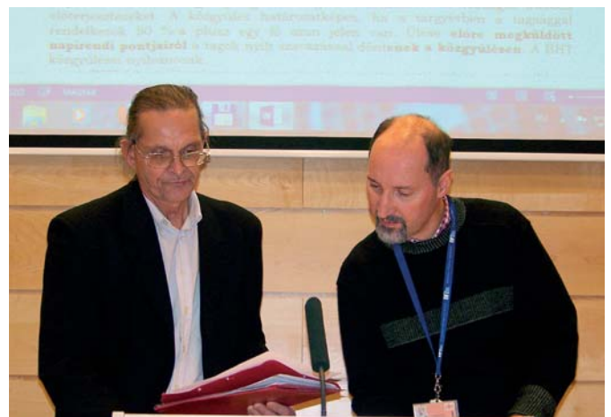
Az egyesület titkára és elnöke a módosított Alapszabályt teszik fel a kivetítő ernyőre a rendkívüli közgyűlésen

oldal terjedelmű, 4 színes oldallal rendelkező volt, számonként 1100 példányban jelent meg és az interneten is teljes terjedelmében olvasha-