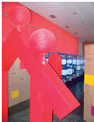
A tárlat bejárata