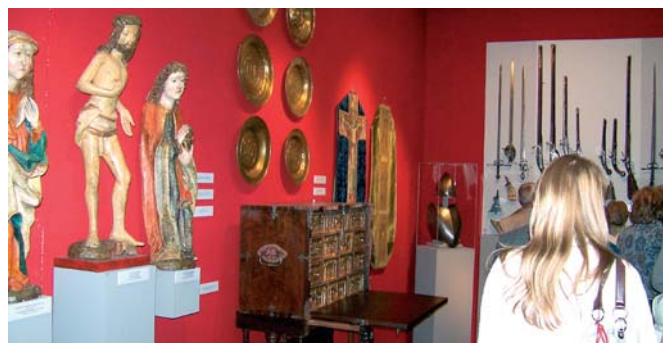
Több mint ezer muzeális tárgyat mutattak be (Otthonok kincsei)

A nyolc évszázad fennmaradt alkotás-remekéi a maguk sokrétűségével jelzik a fővárosi magángyűjtők magas szakmai hozzáértését, az elmúlt korok értékeinek megmentése iránti elkötelezettségét.