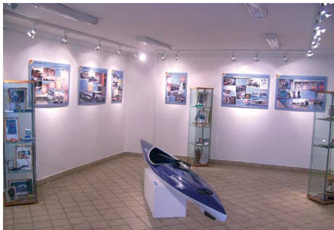
Külön teremben Újpest strandolási, sportolási emlékei

gekből tudhatta meg a látogató a lényeges adatokat. A