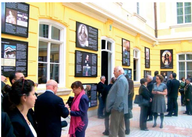
Közel 70 tablót várta a megnyitóra érkezőket (Akik hittek Törökországban)

A kiállítások sorozatát a Török Köztársaság Akik hittek Törökországban című vándorkiállítása nyitotta meg, amely október 4-től volt látogatható a Barokk Csarnokban – emlékezve az 1923-ban Magyarország és Törökország között kötött Barátság egyezmény 90. évfordulójára.