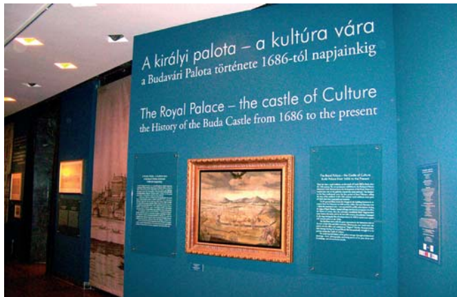
Magyar és angol nyelvű kiállítási feliratok segítik az eligazodást

A korabeli berendezés megőrzött emlékei, hiteles falburkolat-rekonstrukciók, festmények, építészeti tervek és műves iparművészeti tárgyak idézik fel a kiállításon az elmúlt évszázadokat. Korabeli festményeket láthatunk az épület történetében (Folytatása a 3. oldalon.)