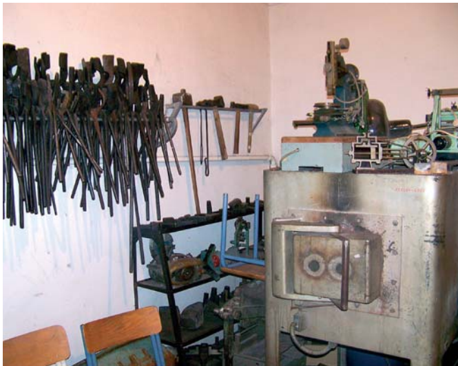
A kovácsműhely egyik sarka – ma már a kiállítás része

Nagy sikerének köszönhetően a jeles alkalomra készített kiállítás állandó tárlattá válhatott, és – jogilag talán