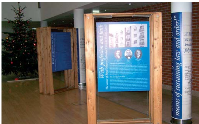
A tárlat földszinti része – Karácsony előtt

vényhatósági bizottságának (mai megfelelője a fővárosi önkormányzat közgyűlése – a szerk.).