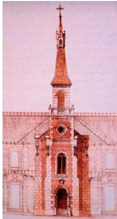
Ybl Miklós tervrajza

Ybl életműve a 19. századi magyar historizmus meghatározó értéke. A romantikus kezdetek után – főleg itáliai tanulmányútjainak tanulságait felhasználva – a historizmus reneszánsz hagyományait elevenítette fel. Az olaszországi emlékeket felhasználva az újkor kihívásainak tett eleget, amikor egyházi épületeket, mint a lipótvárosi Szent István Bazilika, templomokat, mauzóleumokat és síremlékeket tervezett, ország-szerte főúri palotákat újíttatott fel és alakított át, Budapest városképének meghatározó alkotásait hozta létre a Fővámháztól az Andrássy úti