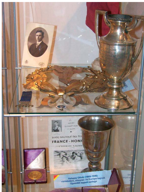
Felül Kutasi György vízilabdázó, olimpiai- és Európa-bajnok relikviái, alul Halassy Olivér vízilabdázó olimpiai- és Európa-bajnok Újpesttől kapott serlege

Elsősorban dokumentumokra épülő anyag digitális nyomdai eljárással fóliázott tablón korabeli fotók, tervek, plakátok és sajtóhírek mellett magyarázó szöve-