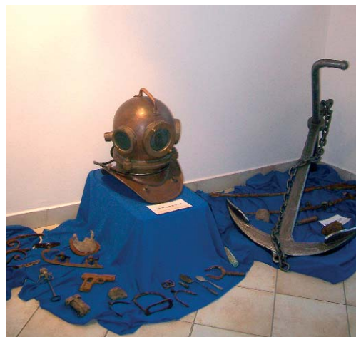
A Dunai Flottilla történetét is bemutatták

A megvalósítást több hónapos munka előzte meg,