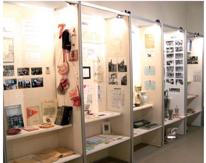
Tematikus tárlók a kiállítás egyik termében

Jól szolgálja nevelési célkitűzéseinket is. Úgy gondoljuk, tanulóinknak a sikeres jövőjük érdekében tett