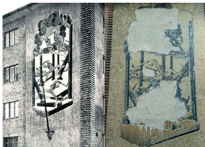
Molnár C. Pál sgraffitoja (Fotó: Halász Árpád – Budapest Székesfőváros középítkezések, 1941)

A jelenleg még látható műalkotások a lakótelep egészének megjelenésével együtt a X. kerület helyi védettségi körébe tartoznak. A Család c. szobrot a Budapesti Történeti Múzeum Budapest Galériája 2013-ban felújította. Ezenkívül a bejegyzés alatt álló Pongrác Egyesület szakértők közreműködését keresi a három megmaradt sgraffito restaurálásának megtervezéséhez, pályázati források felkutatásához, valamint a Pongrác