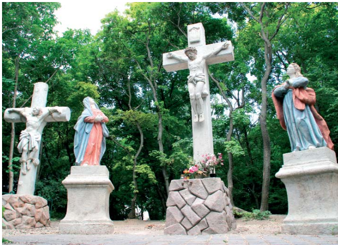
A Kiscelli Kálvária Golgota-szoborcsoportja a restaurálás után

2007-ben egy hagyományőrző rendezvényünk alkalmával a Farkastorki