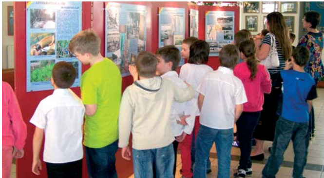
A tárlat kihelyezett iskolai tanórak helyszíne is volt