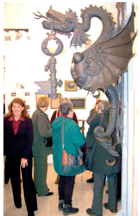
A kiállítás „névadója”

A család tagjainak sorsa tipikus 20. századi magyar történet: sikeres kis-