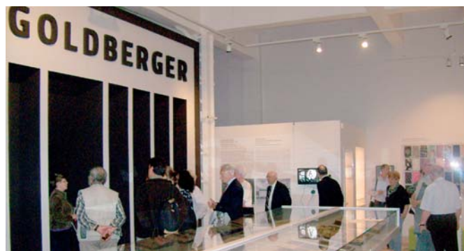
Közgyűlésünk a Goldberger Textilipari Gyűjteményben tárlatvezetéssel kezdődött