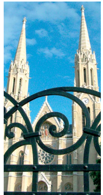
A Rózsák terén álló templom

A 175 éve, Pesten született Steindl Imre emlékét szobor őrzi a parlamentben és utca-