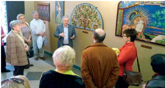
Újpestiek a Róth Miksa Emlékházban

Róth Miksa Üvegfestő és Mozaik Műintézete a zsidótörvények következtében 1939-ben szüntette be tevékenységét. A múzeumban