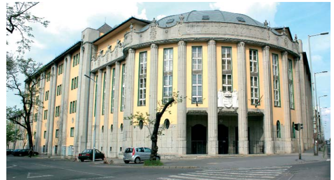
Az egykori Állami Főgimnázium – ma Szent László Gimnázium

Az épület legelső tervei 1913-ból valók, melyeken ugyan szerepel Lechner