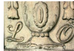
Lechner Ödön monogramja a főhomlokzaton