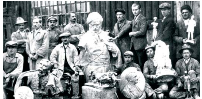
A Szili öntöde

szerény ember volt, aki egyébként a kerület társadalmi életében is szerepet játszott.