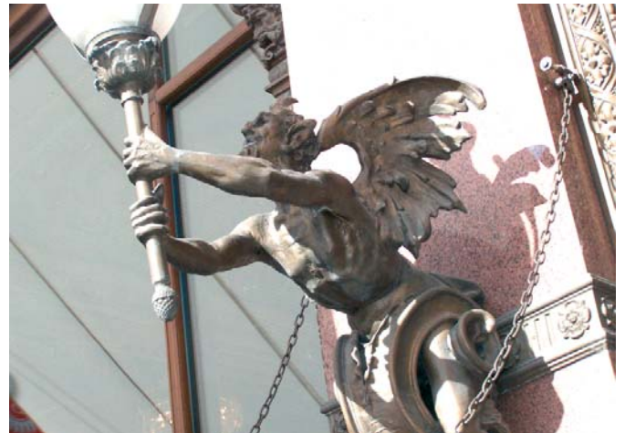
Díszes falikar a New York palota homlokzatán