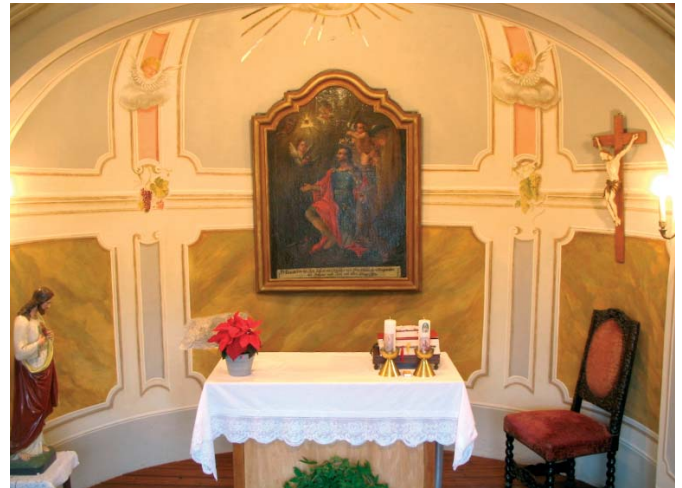
A Szent Donát szentély restaurálás után

úton megtekintettük az 1781-ben épült Szent Donát kápolnát. A társaság arra lett figyelmes, hogy a csehsüveg boltozatot tartó boltív közepén igen komoly repedés van. Építész, statikus, geológus társaink segítségével megtaláltuk a leghatékonyabb megoldást. Acél hevederrel aroncsoltuk meg a kápolnát, mire a repedés becsukódott. Ezután nem volt más, mint a kápolna felújítása, a falak vizesedéseinek megszüntetése, korhadó ácsszerkezetének és széltől bille-