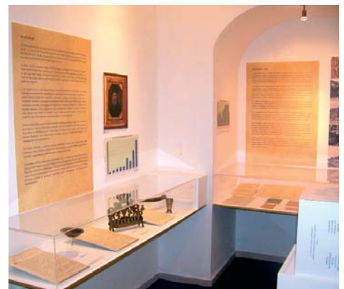
A 18. és 19. század – óbudai zsidó emlékek

A kiállításban a zsidó kultúrának a legismertebb szimbólumai is szerepet kaptak, így a hét egység mindegyikét egy-egy stilizált menóra vezeti be, amelynek annyi gyertyája ég, ahányadik egységet jelöl, illetve a valláshoz kapcsolódó tárgyak egy hatalmas Dávid-csillagot formázó tár-