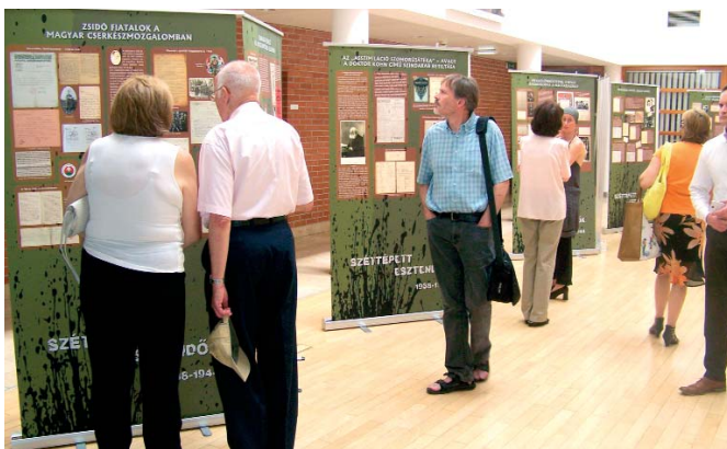
Budapest Főváros Levéltára aulájába kihelyezett molinók