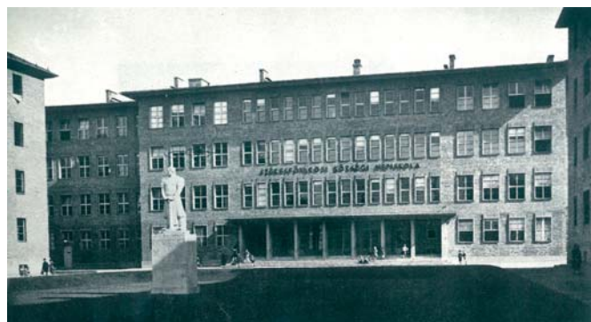
Pongráctelepi „Székesfővárosi Községi Népiskola” ülső frontja a Munka szoborral