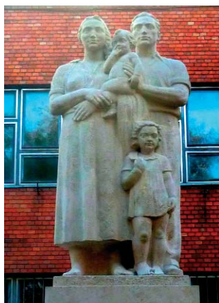
Győry Dezső: Család, felújított szobor

Aki a X. kerületi, Gyöngyike utcai Pongrác Községi Házba téved, egy kicsi, de látványos helytörténeti kiállítást tekinthet meg. A fali tablók az idén 75 éves Pongrác úti lakótelep 1939–1942 közötti felépítéséről korabeli sajtófotókkal és magánfényképekkel, alaprajzokkal és térképekkel, bizonyítvánnyal, lakbérkönyvvel ismerkedhetünk. Jó idő esetén egy tízperces sétával kör-