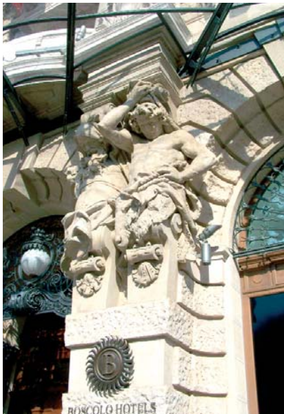
A szálloda bejárata, atlaszokkal