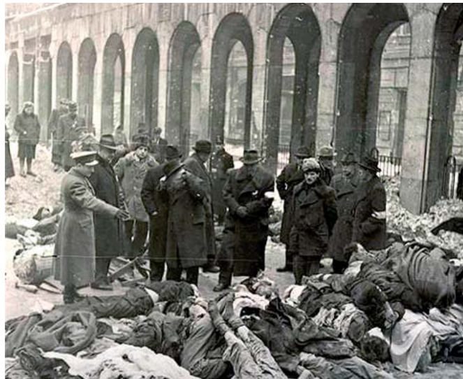
Halottak hevernek a Dohány utcai zsinagóga udvarán, 1945 januárjában

Jobbak voltak a budapesti lehetőségek. Itt amúgy is maradtak zsidók, mert Hor-