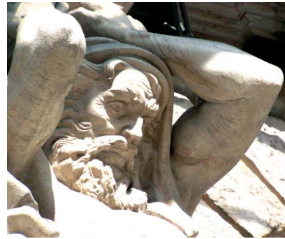
New York palota – öreg férfi atlasz

Az előirányzott összeg 2 millió frank volt. A díjnyertes terv