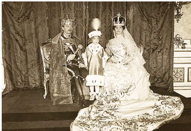
Az utolsó magyar király, IV. Károly, felesége Zita és gyermekük, Habsburg Ottó a koronázás után

Mátyás, hivatalos nevén Nagyboldogasszony templomot vörös posztóval vonták be.