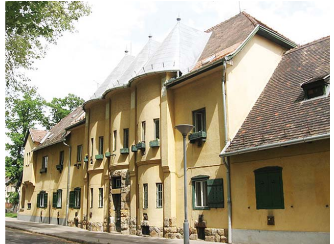
Házak az óbudai gázgyár munkáslakótelepén

Budapesten a kertvárosok két ilyen igen szép példája Óbudán a Gázgyár közelében, a vasút és a Duna által határolt területen valósult meg. Rendezési terve illeszkedik az adottságokhoz és az igényekhez, munkás és tisztviselő lakások épültek, városi funkciókkal együtt. A Duna-parti telep 9 szabadon álló épülete 17 tisztviselői lakást tartalmazott, tervezője Reichl Kálmán (1879–1926). Az aquincumi múzeum melletti, több száz lakásból álló munkás-sorházak