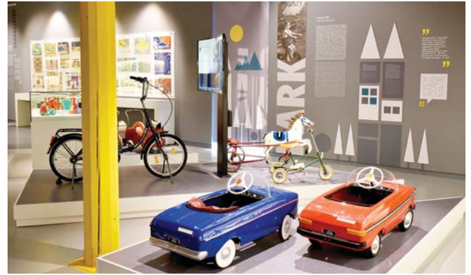
Játékiállítás a múzeum új, emeleti részén

A következő években elsősorban babaszobabútorok, miniatűr porcelán étkészletek, konyhai felszerelések, különféle mechanikus játékok, litografált lemeztárgyak, kőépítő készletek, gőzgép-modellek, laterna magica kerültek a gyűjteménybe. 1988-ban rendezett először teljes egészében saját gyűjteményi anyagra építve kiállítást a múzeum, aminek különlegességét az