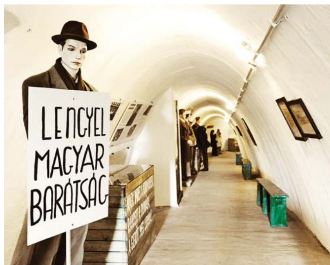
Az állandó kiállítás egész évben várja látogatóit

gyelhetők. A terület azonban nem csak természeti látnivalói miatt különleges. Már a második világháború végén is létezett itt egy kisebb bunker, ami az 1950-es évek elején az egész domb alját átszövő óvóhellyé épült ki.