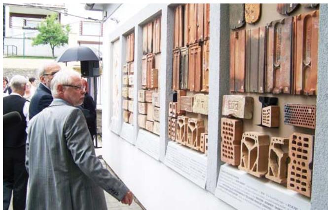
Négy belső-óbudai téglagyár termékei az állandó kültéri kiállításon

let), az általa üzemeltetett Táborhegyi Népházban.