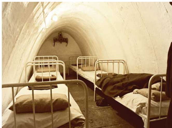
A Tamariska-domb alja az '50-es évek elején óvóhellyé épült ki

Csepel az 1956-os forradalom és szabadságharc első napjától aktívan részt vett az eseményekben. A szovjet intervenció után a helyi nemzetőrök a szomszédos Szigetszentmiklós határában lévő légvédelmi ütegtől több ágyút is bevontattak a kerület központjába. Véres harcok kezdődtek, végül november 11-ére a csepeli ellenállás is megadásra kényszerült. Ezekben a napokban a Tamariska-domb alatt