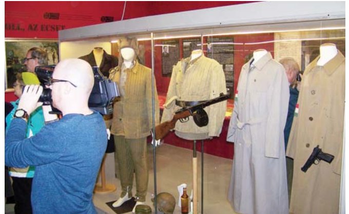
'56-os öltözetek – pufajka és esőkabát karszalaggal

A forradalom kerületi eseményei és szereplői