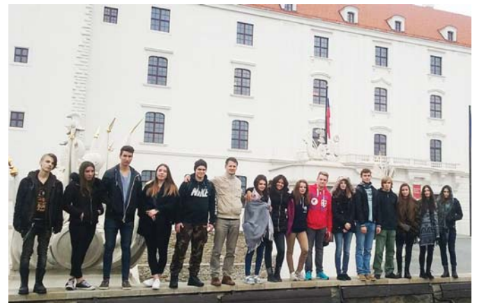
Diákjaink a pozsonyi várban