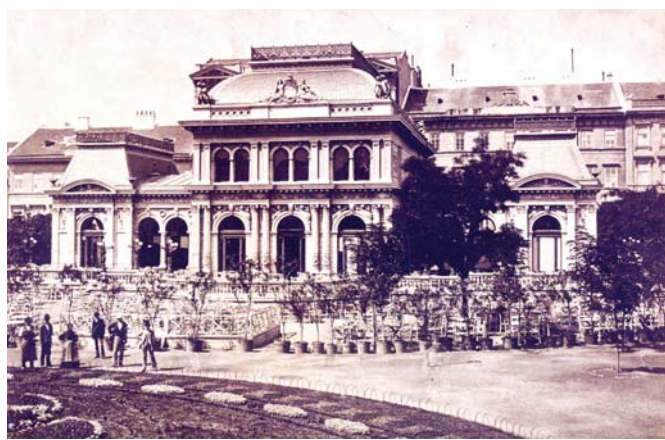
Az Erzsébet tér a Kioszkkal

zött változások tervpályázatokban megjelenő korábbi szakmai vitákat elevenítenek fel. Ezek publicitást kapnak, civil szervezetek véleményezik pro és kontra érveikkel, majd a kormányzat valamint ellenzéke közti politikai vitát generálnak. Emlékezzünk csak a kormányzati negyedre, a Kossuth Lajos térre, a Várkert Bazárra, a Széll Kálmán térre, napjainkban a Városligetre. Mindez természetes, a polgári demokráciák jellemzője. Már nem oly korban élünk, ahol sajtóvisszhang nélkül, egy tollvonással elvehetik Budapesttől kiállítóhelyét (Múcsarnok – 1952), művelődési központját (Budai Vigadó – 1952), vagy lebontják az Erzsébet téri Nemzeti Szalont (1960).