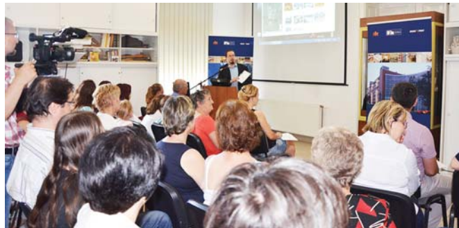
Az első hazai topotéka 2016. június 18-án, Berettyóújfalun

A projektet a bécsi székhelyű International Centre for Archival Research (ICARUS) fogja össze. Partnerintézményeink 11 ország 17 levéltára és egyeteme Svédországtól, Észtországon, Németországon, Ausztrián át Spanyolországig. A projekt megvalósítási időszaka 2014. december 1-jétől 2018. no-