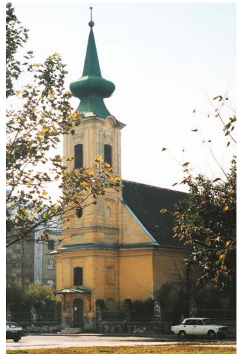
Templomuk alapkövét 1785-ben rakták le