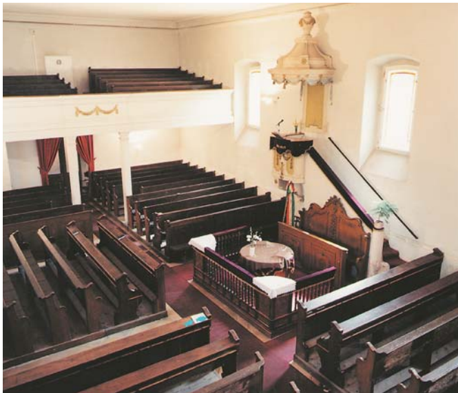
Óbudai református templom belső tere

években a település többször elnéptelenedett, azonban a lakosság mindig visszatért, és a visszatérők jó része a református egyházhoz tartozott. Buda visszafoglalását követően, az első visszatelepülő családok is református magyarok voltak, és egyházközösségük az uradalmat birtokló Zichy-családtól – iszentiszteleik megtartására – megkapta a középkorból itt maradt, egyetlen használható templomot. Azonban az