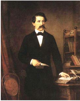
Arany János Barabás Miklós festményén