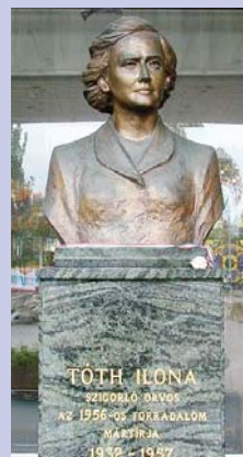
Tóth Ilona szobra a Nagyváradi téren (SOTE)