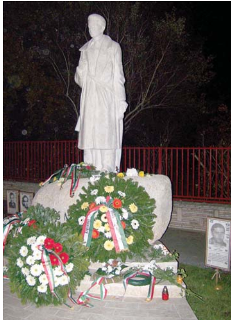
A Rákoskerti Polgári Kör és a Rákosmenti '56-os Alapítvány állította Nemzetőr emlékmű

lehet javítani azokat a hibákat, amelyek csak az eredeti nagyságban láthatók. Ha a művész és a megrendelő is elégedett a változtatásokkal,