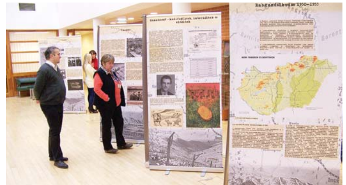
A konferenciái szünetében a VERITAS Történetkutató Intézet kiállítását is meg lehetett tekinteni