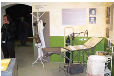
Pincekórházat ábrázoló enteriőr a tárlaton