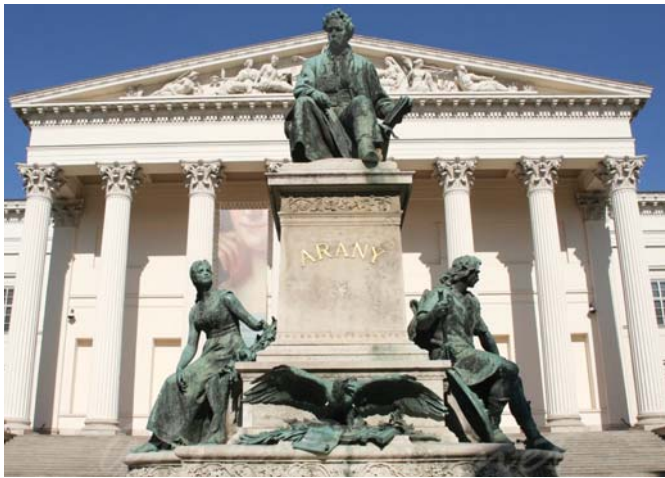
Arany János emlékszobra a Nemzeti Múzeum főbejárata előtt – mellékalakjai: Toldi Miklós és szerelme, Piroska (Stróbl Alajos, 1893)

A kiállítás tematizálva mutatja be az ismert, kevésbé ismert, és ismeretlen óbudaiakat, akik a harcokban bármikor válhattak hőssé vagy áldozattá. A tárlat célja, hogy rávilágítson a fegyveres és politikai harcok mögötti egyszerű óbudai emberek szerepére, történeteire a sorsfordító időszakban. A több, összetett részből felépülő kiállítás eseményeket, színtereket, személyeket kapcsol össze egy egységes egésszé. Rötzer (Folytatása a 3. oldalon.)