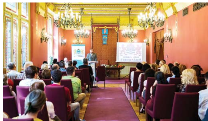
Ferencváros házasságkötő termében a „hely szelleme” iránt érdeklődők

Ferencváros legkorábbi tárgyi emlékei a 13. század második feléig nyúlnak vissza. A mai Szabadság híd és Petőfi híd közötti területen húzódott a Szenterszébetfal (Folytatása a 7. oldalon.)