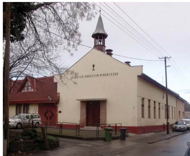
Prém Margit újpesti háza ma az Újpest-Újvárosi Református Egyházközség temploma

körül bárói rangot kaptak és rekatolizáltak.