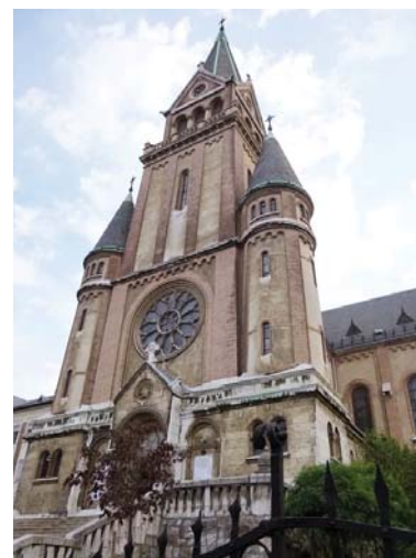
A templom főbejárata

Betekintést nyerünk a templom hitéletébe is a visszaemlékezésekben. Itt tevé-