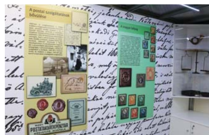
Kiállításrészlet a postakocsiból

A Magyar Posta e jubileum emlékére a „mozgó postamúzeum” mellett hat bélyegből álló sorozatot adott ki, amely a postai járművek fejlődését mutatja be a lovas postakocsitól napjainkig. Szintén a jubileumra emlékezik a terézvárosi