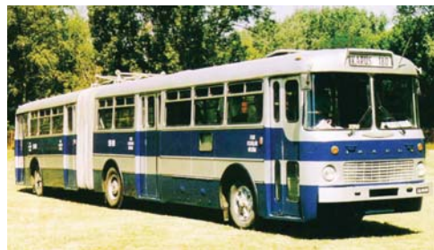
Négy járatot teljesített a Hegyvidéki Napokon

A Hegyvidéki Helytörténeti Gyűjtemény az elmúlt években rendszeresen szervezett városnézést a Hegyvidéken, melyekre legtöbbször egy nyitott tetejű Ikarus 630-as kabrió busz vitte a látogatókat. Idén azonban június 11-én, a Hegyvidéki Napok keretében, egy 1972-ben gyártott Ikarus 180-as csuklós busszal jár-