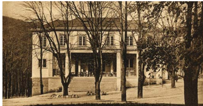
A Hild József által tervezett Fácán üdülő-szálló az 1920-as években

ló tervezésére. 1856-ra fel is épült az új épület, melyben harminc vendégszoba várta a kapcsolódni vágyókat. Úgy alakították ki az „U” alakú épületet, hogy minden vendégszoba közvetlenül