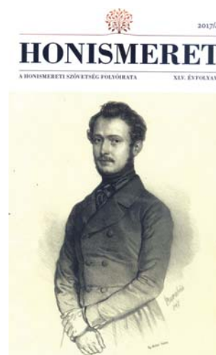
A megújult Honismeret folyóirat címlapja (2017/augusztus)

A Sárospataki Református Kollégiumot 1531-ben alapították, az Akadémiának is helyet adó épülete 1806-ban, klasszicista stílusban ké-