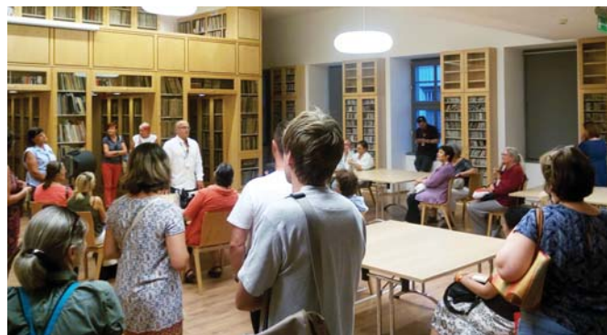
Helytörténeti sétájuk a Budapest Music Center Könyv- és Kézirattárában ért véget

érdeklődők. Kevesen tudják talán, hogy amikor 1879. április 24-én a Bakáts téri templomot felszentelték,