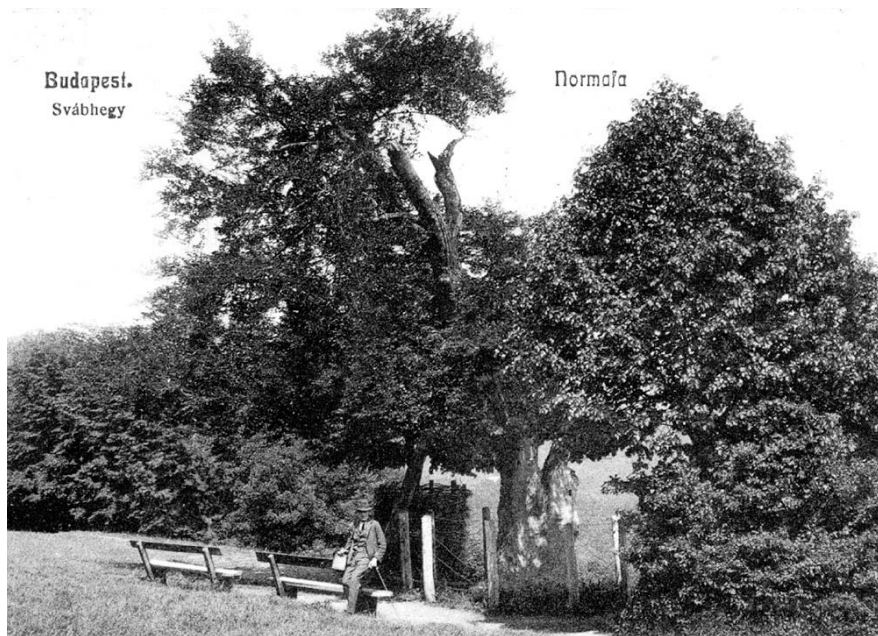
Normafa a 20. század elején

azaz a fizetésüket, amit itt mulattak el, ennek a hatalmas bükkfának az árnyékában. Más források azt valószínűsítik, hogy amikor 1840-ben a kor kedvelt színésznője, Schodelné Klein Rozália megkapta az öt ünneplő közönség elismerésének díját, akkor a bükkfa által megihletve – mely annyira hasonlított Bellini Norma operájának díszletére – el-