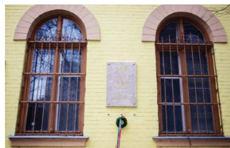
Emléktábla a Városháza falán

Mindkét köztéri alkotás megvalósítását az Emberi Erőforrások Minisztériuma megbízásából az Emberi Erőforrás Támogatáskezelő 2016. évi pályázatán elnyert támogatás segítette. A kispesti egyesület által a Templom téren emelt emlékművet ezen felül a kispesti lakosok