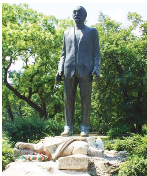
A Wekerle-telep központjában áll Kós Károly szobra