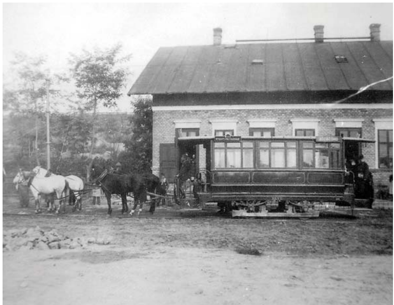
Lóvasúti kocsi kettős előfogattal. Ilyenek jártak a zugligeti vonalon is