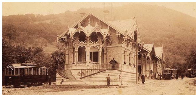
Várócsarnok a 19. század végén

1882-ben e kérdés függőben maradt, mert a BKVT állomási telkét a főváros kisajátította a Zugligeti út szabályozása miatt. Új elgondolásuk szerint díszes építményt kívántak emelni, „tekintettel a zugliget remélhető emelkedésére”, illetve hogy „a fővárosi közönség-