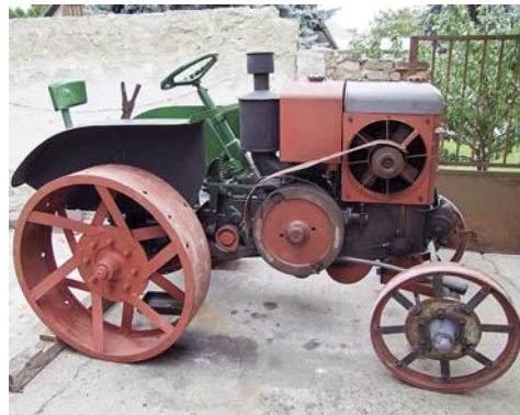
1924-ben gyártott kispesti Hofherr traktor

bek, erőszakot megvetők több eséllyel találtak reális megoldásokat. 15 új üzem, élükön a világhírű Hofherr