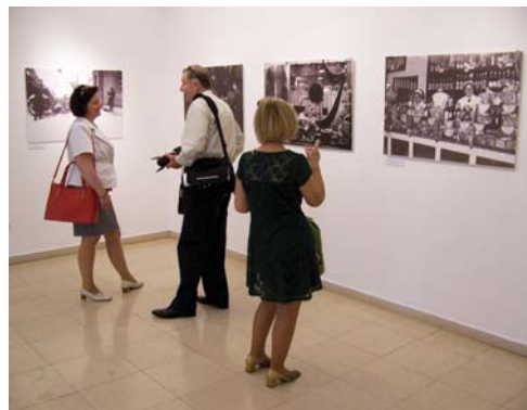
A középső teremben fekete-fehér archív fotókkal szembesülhettünk

A Ferencvárosi Helytörténeti Gyűjtemény mintaértékű együttműködést realizált a Pesterzsébeti Múzeummal. A pesterzsébeti Gaál Imre Galériában a ferencvárosiak 2016. szeptember 14-én öt