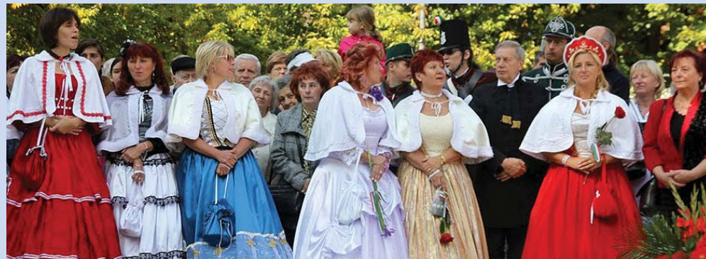
Reformkori ruhákba öltöztek

rúzásai, a Csili Étterem reformkori ebédje, reformkori zenék... adták azt a hangulatos keretet, amelyet a szervezőktől már természetesnek vettek az egész napos rendezvénysorozat ifjú és kevésbé fiatal látogatói.