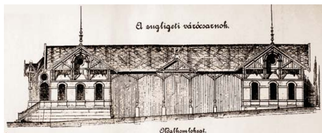
A várócsarnok terve (Tervrajz: Magyar Mérnök és Építész-Egylet Közlönye, 1887., XXI. kötet, X. tábla)

A 40 méter hosszú és 10 méter széles megvalósult épület végül 500 személy befogadására alkalmas, oszlopokon nyugvó nyitott csarnokból, két végén „szilárdan épített” pavilonokból állt. Egyik pavilonban a posta, távirda és a dohánytőzsdé, míg a másikban a kocsi-vezetői laktanya, az állomásfőnöki lakosztoba és iroda