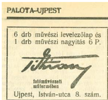
Egyik műtermének hirdetése