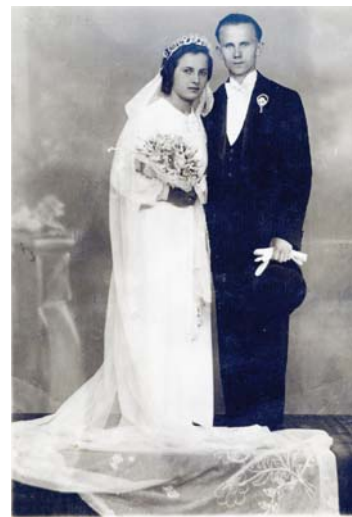
Esküvői fotó a Tizian Fotóműteremből – Árpád út 73.

Művészember lévén, hiú módon vigyázott külső megjelenésére is, a családi hagyomány szerint például élete utolsó percéig festette a haját. Orvosi vélemények szerint talán száz évet is