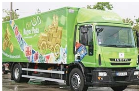
A postatörténeti tárlat hordozója

Benczúr utcai 27-beli Benczúr Ház második emeleti kiállítóhelyén a 150 év-150 tárgy című időszakos tárlatuk, amely a magyar postaszolgálat 150 éves történetét postai tárgyak, munkaeszközök és dokumentumok segítségével tárja elénk. Kiállításuk december végéig tekinthető meg.