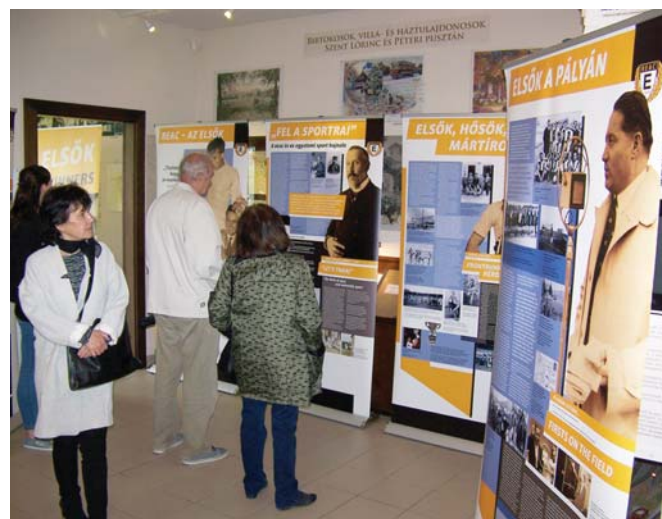
A BEAC olimpiai aranyérmeseit bemutató tablók egy része a Múzeumsarokban

Pestszentlőrinc és a Budapesti Egyetemi Atlétikai Klub