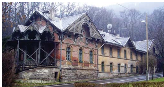
Az épület 2009-ben...

árnyékszékeket létesítettek, és megoldották a szennyvízelvezetést is. Az átalakítás nagyszét a terveknek megfelelően történt, eltérésként mutatkozott, hogy a ház felső végén utasoknak fenntartott váróhelyiséget a rendőrség őrszoba céljára igénybe vette, ezért azt a középső részben alakították ki. Egy 1930-ból származó kimutatásban nincs utalás e helyiségre, tehát lehetséges, hogy 1930-ig vagy átalakították ezt is lakássá, vagy mégsem vették e célra használatba... Az épület átalakítási-beépítési munkáit részben 1922 júliusa és decembere között