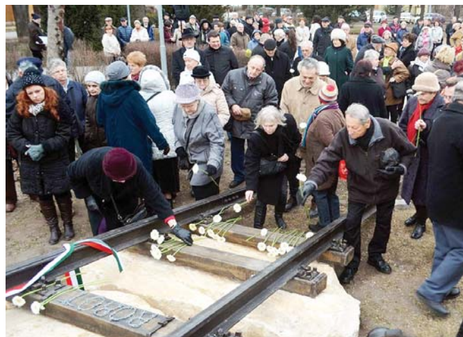
A Kispesti Társaskör egyesület emlékművének avatása (Fotó: kispest.info)

téglajegy vásárlásával, Kispest önkormányzata az alapjának elkészítésével is támogatta.