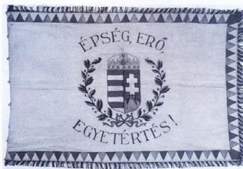
Az UTE zászlójának két oldala

nos és barátai szervezésének köszönhetően – 1885. június 16-án tartott alakuló közgyűlésén az Újpesti Torna Egylet (UTE) 78 alapító taggal jött létre. A lila-fehér színt válasz-