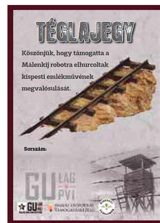
A kispesti GULAG-emlékmű téglajegy

Benczúr utcai 27-beli Benczúr Ház második emeleti kiállítóhelyén a 150 év-150 tárgy című időszakos tárlatuk, amely a magyar postaszolgálat 150 éves történetét postai tárgyak, munkaeszközök és dokumentumok segítségével tárja elénk. Kiállításuk december végéig tekinthető meg.