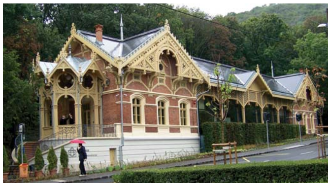
... és felújítása után napjainkban

A Budai Közúti Vaspálya Társaság 1868. június 30-án indította lóvonat-forgalmát, zugligeti állomásfőnöke számára a végállomáson személyzeti célú épületet emeltetett. Az utasváró helyiség tervét és költségvetését csak később, 1873-ban készítették. Nagy valószínűséggel nem valósult meg, vagy csupán rövid ideig állhatott, mivel a vonalat 1879-ben átvevő Budapesti Közúti Vaspálya Társaság a következő évre tervezte be: „A mi különben a zugligeti várócsarnokot illeti, szándékunk a végleges váróterem létesítéséig a közönség érdekében egy ideiglenes csarnokot is felállítani”. Tehát ekkor váróterem nem állt. Az új épület tervét a következő évek költségvetéseiben is megtaláljuk: 1883-ra egy 100 fő befogadására alkalmas várócsarnokot kívántak emelni, ám a fővárosi hatóság kívánsága szerint 600 személyes csarnokot kellett volna létesíteni, ami az előirányzott költséget jelentősen megemelte.