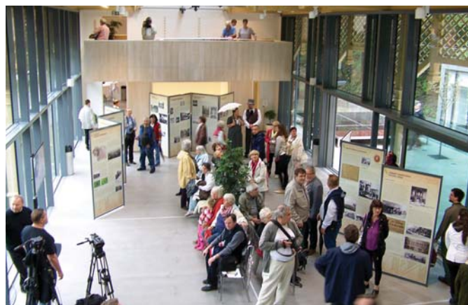
Központi közösségi térben várakozók a Zugliget-történeti kiállítás tablójánál

„Jókedvében teremté Isten a Zugligetet, Gond és bánat itt víg kacagásra derül” – jól ismerik a helyiek Vörösmarty Mihály véleményét e térségről. A vigalomra ma ismét volt alkalom: Hegyvidék önkormányzatának köszönhetően megvalósult a svájci stílusban épült, műemléki védelem alatt álló egykori zugligeti lóvasúti végállomás