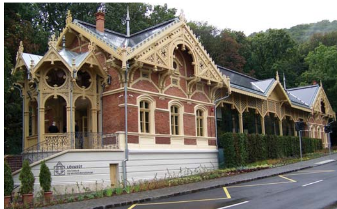
Felújítását az önkormányzat végeztette el