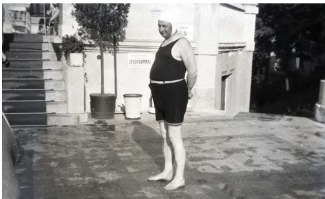
Kleberlsberg Kuno miniszter a harmincas években a Gellért fürdőben