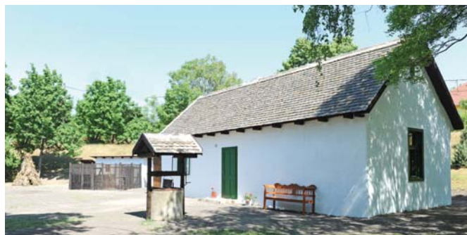
Királyerdei Tájház – lebontott elődje az 1930-as évek közepén épült

dezést kapott, mely élénk tárja az 1930-as évek csepeli átlagemberének mindennapjait, ötvözve a még erősen vidékies élet sajátosságait a gyárvárosi lét szokásaival, használati tárgyaival, helyi vonatkozásokkal.