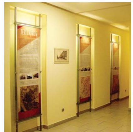
Az Eötvös10 aulájában a Terézváros 240 éves kiállítás anyaga

Nem feledkeznek meg a fiatalabb korosztályról sem – az Eötvös10 néptánc csoportja szerda délutánonként az óvodás és alsó tagozatos gyermekeket vezeti be a néptánc rejtelmeibe.