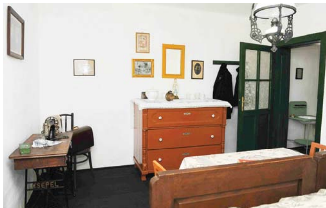
A lakoszobában kisipari bútorok, helyben készült termékek

Május 1-jén megnyílt a Csepeli Helytörténeti Gyűjtemény újabb muzeális bemutatóhelye, a Királyerdei Tájház. Csepel Királyerdő nevű városrésze uradalmi erdő volt évszázadokon át, majd a királyi család magyarországi vagyonkezelősége átengedte azt a Magyar-Hollandi Bank