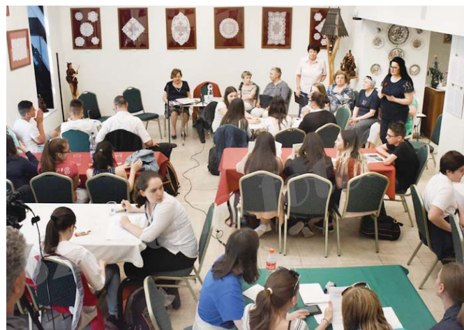
A vetélkedő második fordulójában épületeket kellett felismerni

volt, létezett egy „Beszélgetés” nevű tantárgy, aminek része volt az iskola háztömbjének utcahomlokzatokkal történő megrajzolása. A házról, utcáról, ahol laktunk szintén mesélni kellett. Később létezett iskolai helytörténeti vetélkedő, emléktáblák, szobrok keresésével, épületek felismerésével, híres kerületi emberek, történelmi helyek ismertetésével, ahol a csapatok csokoládét,