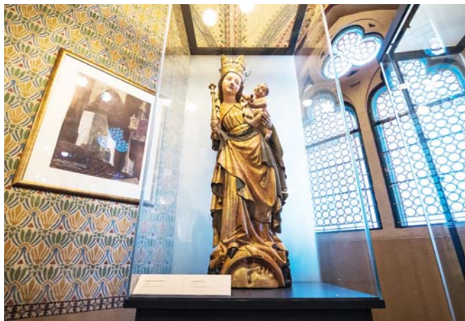
Restaurálását Galambos Éva és Samu Erika végezte el

gart mutat fel. Vállát kendő takarja, fején szőlőlevél mintázatú korona nyugszik. A gyermek a szentlélek szimbólumát, egy galambot tart a kezében.