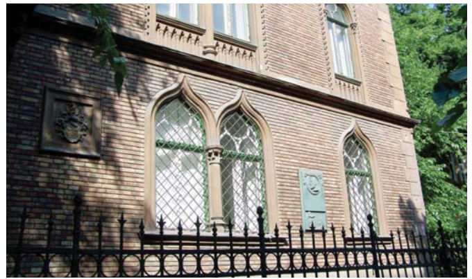
A Bajza utcai Feszty-villa falán az 1925-ben a főváros által Jókai Mórnak állított emléktábla – „...itt érte meg 1894. január 6-án fél évszázados írói jubileumát”

A millenniumra már ekkor készülő székesfővárosi vezetés neves művésztanárait az Epreskert körüli olcsó telkek juttatásával segítette. Zajló „társadalmi élete” kapcsán akkortájt közülük az egyik legismertebb az Epreskert bejáratával szemben fekvő, Bajza utca 39. szám alatti Feszty/Jókai-villa volt. A Golgotájáról, majd a millenniumi kiállításra 1896-ban festett Magyarok bejövetele című