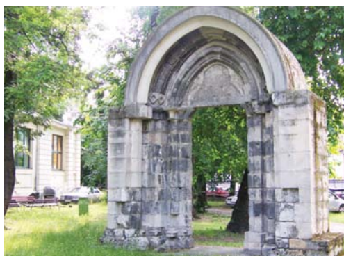
A Mátyás-templom 13–14. századi eredeti délkeleti kapubejárat

épülete az a velencei stílusban készült ház, melyben az ünnepeket nagy költő lakik... A verandán át belépve, az előszobába nyitunk. Szemben a műterem, jobbra a lakószobák nyílnak. Nagy, tágas műterem, a legnagyobbak egyike a fővárosban. Hatalmas ablak a tárgyak s művészi alkotások egész seregét világítja meg... Egyik oldalát magas karzat foglalja el, a mely az emeletre, Jókai lakosztályába vezet... Ez itt igazán Jókaihoz illő lakás!”