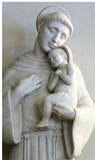
Szent Antal szobra az előcsarnokban áll

Az 1838-as nagy árvíz a berendezési tárgyakat kisebb mértékben megrongálta. A Szeplőtelen Fogantatás dogmájának kihirdetése után (1854) a templom főbejáratánál lévő kápolnát