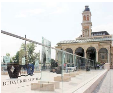
Az Ybl tervezte, a firenzei reneszánsz stílusjegyet viselő Várkert Kiosk Budai Kreatív Ház néven kapott új funkciót

A meghitt hangulatú rendezvényen Gódor Csaba, a Lechner Tudásközpont új vezérigazgatója köszöntötte a megjelenteket: Ybl Miklós egyetlen fennmaradt mon-