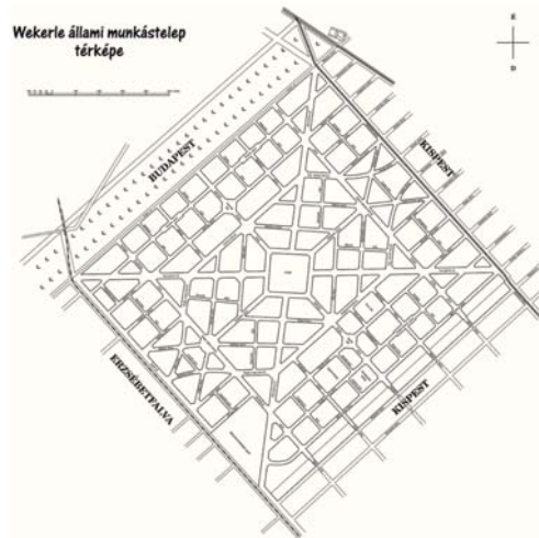
1909-ben vette kezdetét a kivitelezés (Térkép: László Gyula, Wekerle Állami Munkástelep monográfiája melléklete, 1926)

A telep minden épülete állami kézben volt; mind a lakók, mind az üzlethelyiséget használók bérlők voltak. A rendeltetésszerű használat előfeltételeinek megteremtését, a helyiségek karbantartását, a telep csinosítását és tisztántartását már az építésével egyidejűleg a Pénzügyminisztérium által létrehozott a Gondnokság látta el. Wekerle Sándor a gondnoki hivatal vezetőjének Győri Ottmárt nevezte ki. Győri tevékenysége a telep aranykorára esett, felsorolni is nehéz lenne mindazt, ami az ő bábáskodása mellett jött létre, vagy a támogatását élvezte. Ezek közé tartozik a Wekerlei Társaskör Egyesület szellemi elődje, a