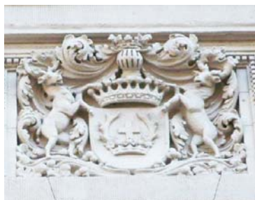
A bejárat felett a Zichyek címere

Budapest klasszicista városképének építészé, Hild József 1867-ben, 78 éves