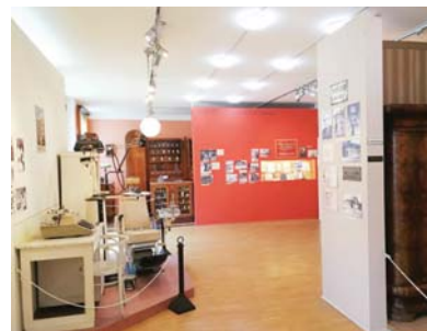
...állandó kiállításából

Sürgető feladat az egykori ipari vállalatok történetének megismertetése. A gyűjtőmunka középpontjába a kerület életét egykor meghatározó, azóta megszűnt ipari üzemek anyagának felkutatása, megőrzése került: többek között az egykori Porce-