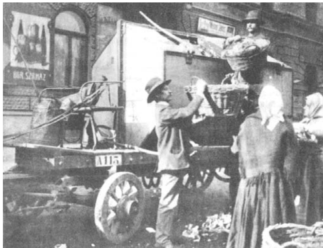
Házi szemét gyűjtése Budapesten a 19. század végén