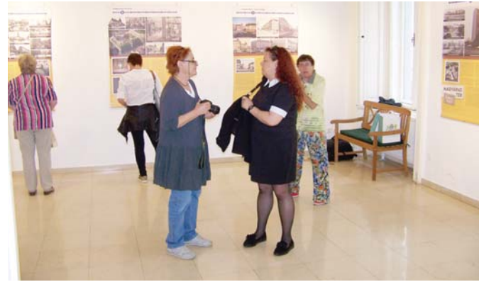
A központi megnyitó előtt a Ferencvárosi Helytörténeti Gyűjtéményben

Budapest szempontjából is fontos volt a környező települések létrejötte, hiszen lakosságuk munkaerőt adott, területükön az apróbb ipari létesítmények mellett megjelentek a nagy fővárosi beruházások. Ez fejlődést jelentett