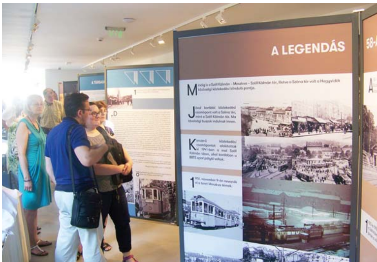
Az 58-as villamosjárat történetét bemutató táblók