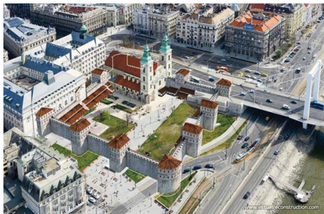
Contra Aquincum erődítményének számítógépes rekonstrukciója – ráhelyezve a Belvárosi plébánia-templomra és környezetére

Az 1083-ban szentté avatott velencei származású Gellért püspököt a napjainkban nevét viselő hegyről a pogány hit követői 1046-ban ledobták, keresztény hívei testét ebben a templomban temették el. Pár év múltán Csanádra, majd később a Velence melletti Murano szigetére szállították, illetve temették el a vértanúhalált