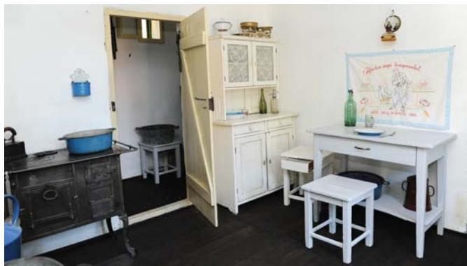
A tájház konyhája és kamrája Csepelről származó berendezéssel

Az eredeti állapotában elkészült épületegyüttes, a ház konyhája-kamrája, utcafronti szobája és a fészter olyan – Csepelről származó – beren-