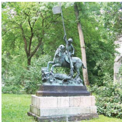
Az 1373-ban készült Szent György lovas szobor másolata

solata, a budavári Nagyboldogasszony-templom (Mátyás templom) rekonstrukciójakor megmentett eredeti, 13–14. századi délkeleti kapubejárat. Itt áll a józsefvárosi Kálvária tér rendezésekor lebontott barokk kálvária – erre Stróbl saját zsebéből a Baross-szobor 3000 koronás pályadíját fordította, növendékeivel lebontatta, majd az Epreskertben ismét felépítette – és láthatunk még sok más, hazánk történelméhez kapcsolódó műtárgyat is. Varázslatos környezet ez, nem szabad kihagyni!