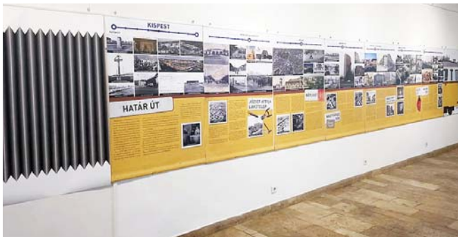
Szeptember 22-ig Kispesten tekinthető meg a tárlat