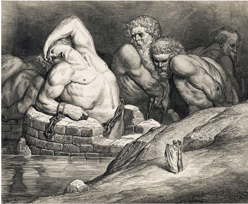
Titánok és gigászok leláncolva a pokolban – Gustave Doré 1861-es Dante-kiadásából

uralta az akkor kis házas, üres telkes környéket.