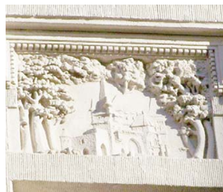
A mai Vajdahunyad vára ábrázolása

Épületünk fő érdekessége a homlokzatot díszítő tükrökben (parapetben) lévő kisebb domborművek sora. Az Október 6. utcai bejárat fölött a Zichy címer utal az építetőre. A szarvas agancsai között egy görög kereszt