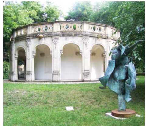
A józsefvárosi barokk kálvária

ritka a 40-50 fős összejövetel sem náluk. A Vasárnapi Újság 1894-es, Jókai lakóháza című cikkében mutatta be házukat: „Az epreskerti művésztelep legérdekesebb s valóban művészi kivitelű