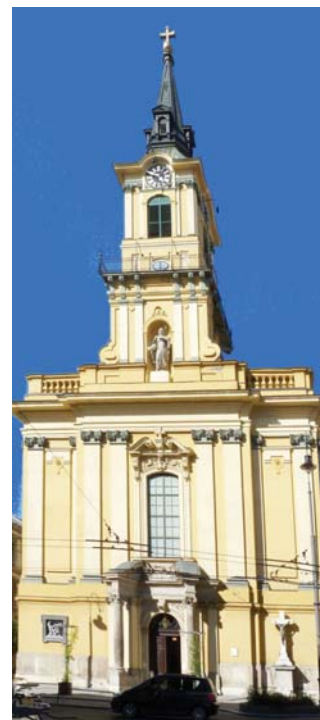
A templom barokk és klasszicista jegyeket hordoz

A négy oltárt Pollack Mihály készítette. 1828-ra elkészült a monumentális főoltár, a templom védőszentje, Szent Teréz extázisát ábrázoló oltárképpel, mely Schöfft József alkotása. A főoltár falában korabeli német feliratú tábla mutatja meddig árasztotta el az 1838-as nagy árvíz az épületet. A