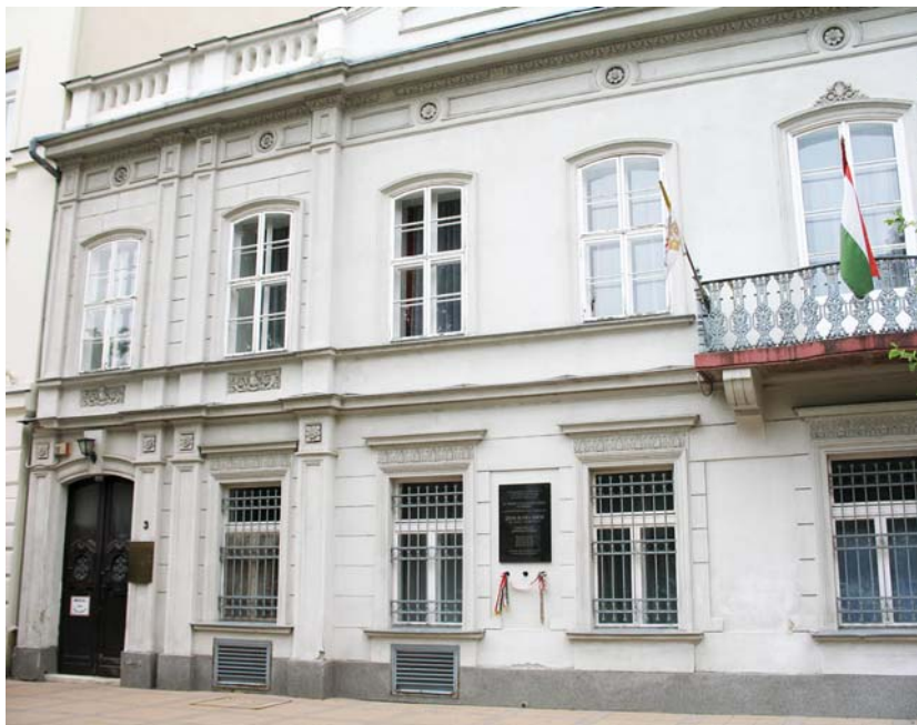
Teleki Blanka iskolája az akkor még földszintes épületben működött – Szabadság tér 3.

oktatással magyarul tanítottak. Teleki Blanka pedagógiai szakíró, az Életképekben megjelent cikkében a sza-