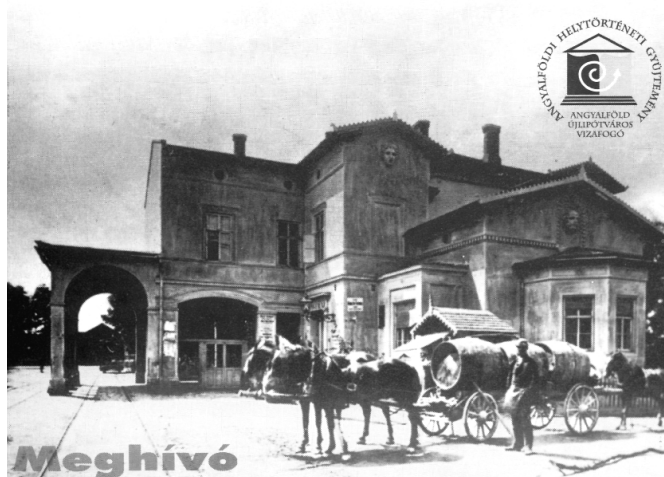
Meghívó a XIII. kerületi Helytörténeti Klub ülésére, a rekonstruált lóvasúti indóházba

épületekről, utcaképekről kapunk összehasonlítást – a fotók szinte azonos pontról készültek. A régimúlt és jelen összevetésének lehetősége nagy érdeklődést keltett a kiállítás megnyitójának minden résztvevőjénél.