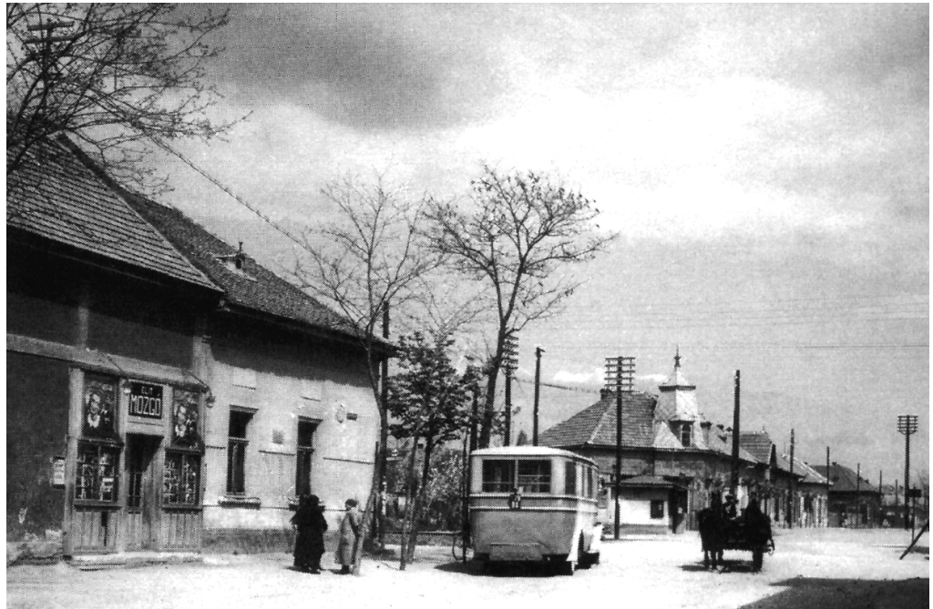
Pestszentimre központja 1938-ban

„büszke” titulust aggaszthatták a Soroksárpéteri név mellé. Az önállóság kivívására már majd 10.000 la-