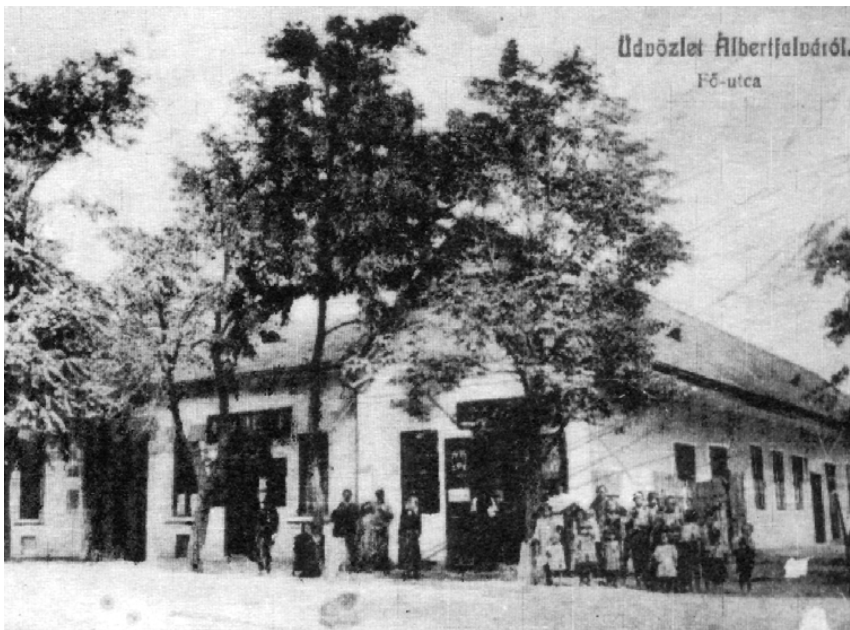
Képeslap a századforduló idejéből