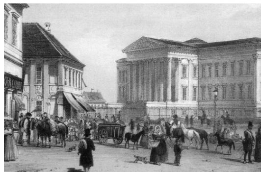
A Nemzeti Múzeum épülete a XIX. sz. közepén (Rudolf Alt rajza)

A tényleges országgyűlés a megnyitást követően két pesti épületben került lebonyolításra. A Képviselőház a Magyar Nemzeti Múzeum dísztermében, a Főrendiház a mai Roosevelttéren, a Pesti Lloyd Társulat szék-