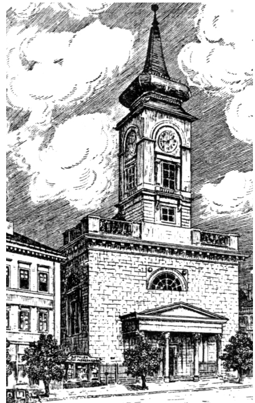
A templom és környéke 1928-ban