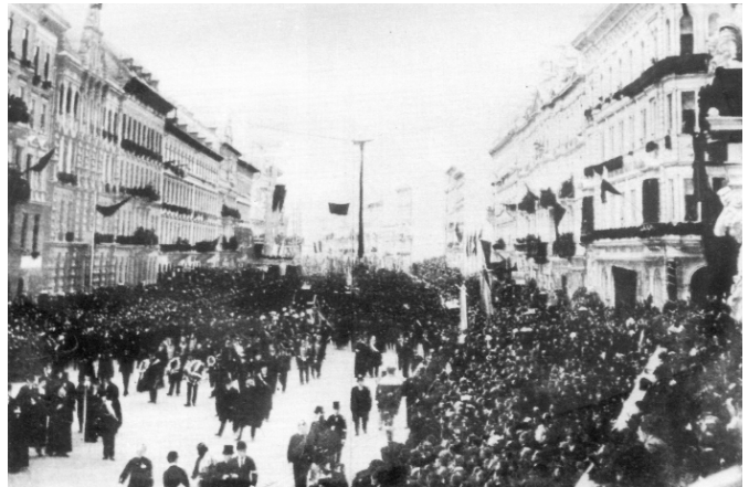
Gyászmenet a Nagykörúton Kossuth temetésekor (1894)

1791-ben a francia forradalom nemzetgyűlése elhatározta, hogy nemzeti panteont állít fel a Sainte Genevieve hegyen levő apátság kápolnában a hazai nagy fiai számára. Ekkor került a homlokzatra a Híres felirat: „A hálás hazai nagy fiaiak”. Jóllehet a történelmi változások következtében ma már használaton kívül van a panteon, mégis szimbolikus emlékhelye Franciaország nagy fiaiak. Mert itt nyugszik többek között Victor Hugótól Zola-ig, a köztár-