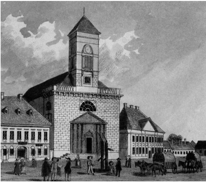
A Kálvin téri református templom 1837-ben (Litográfia Carl Vasquez térképsorozatából)

Nevezetes esztendő 2001 a református egyház életében. Pest város tanácsa 200 éve határozott arról, hogy rendelkezésre bocsát egy telket a városkaputól délre lévő, jobbára a mai Lónyay, Erkel és Török Pál utcák által határolt területen templomépítés céljára.