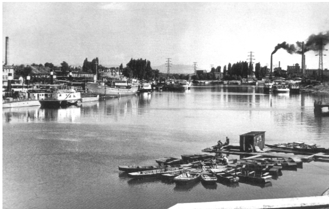
Az újpesti öböl a 30-as években

„A Káposztás-Megyeri Duna parton az Uraság által ki-