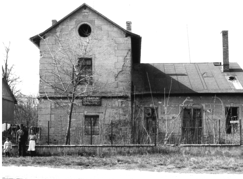
Termelészövetkezeti szeszifőzde otthonaként