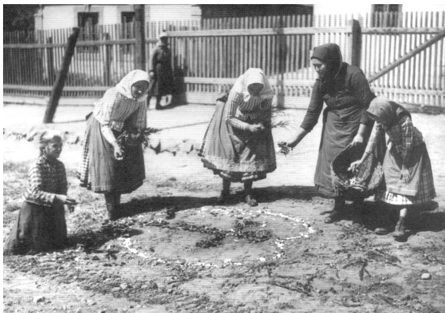
Az ünnepi körmenetre virágokkal díszítették a cinkotai utcákat