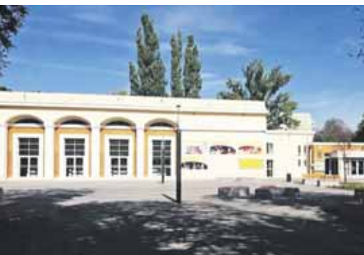
Corvin Művelődési Ház és Erzsébetligeti Színház