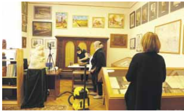
Koncz Vilmos fafaragó szobrának restaurálása a kutatóteremben