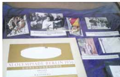
Értékes tárgyi anyag volt a tárlókban