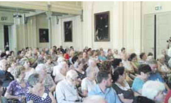
Előadásai a Debreceni Református Kollégium Dísztermében voltak

A Honismereti Szövetség és a Hajdú-Bihar Megyei Honismereti Egyesület Debrecenben, július 5–9. között rendezte meg a XLVIII. Országos Honismereti Akadémiát Trianon 100+1 – Szétszakítva is egységben címmel. A konferencia fővédnökségét dr. Varga Judit egészségügyi miniszter vállalta.