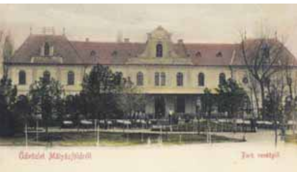
Az átépített Nagyvendéglő (Park vendéglő)

Ma, ha sétát teszünk az egykori Ómátyásföld területén, lépten nyomon felfedezhetjük az épületeken a jellegzetes Paulheim stílust néhány szépen felújított épületen. Paulheim József Mátyásföldön, 1921. február 10-én hunyt el. (Az anyakönyv bejegyzése szerint Cinkotán.)