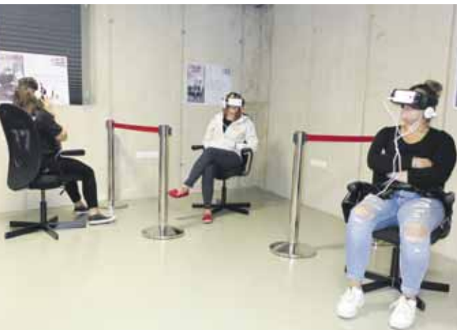
'56-os „kiállítás” VR szemüvegekkel

vel célunk volt, hogy az iskolás korosztály (általános iskola felső tagozata, középiskolások) érdeklődését ezzel az új technológiával keltsük fel a téma iránt. Látogatói nem csupán a kiállítás szemléltetői voltak, hanem az események részeseinek is érezhették magukat.