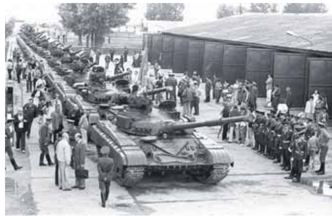
Szovjet T-64-es harckocsiszereg búcsúztatása a kivonuláskor

volt a Déli Hadseregcsoport főparancsnoksága, és szovjetek