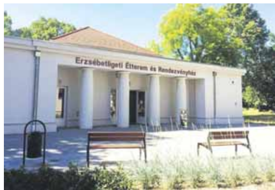
Erzsébetligeti Étterem és Rendezvényház

használták a Mátyásföldi (katonai) repülőteret is. A kivonulás után a katonai bázis épületeit a XVI. kerület, Kertváros önkormányzata példamutató módon hasznosította. Felújítás után a néhai szovjet kultúrházban a Corvin Művelődési Ház – Erzsébetligeti Színház, a szovjet étteremben az Erzsébetligeti Étterem és Rendezvényház kezdte meg életét. A felújított szovjet tisztai lakások az '56-os forradalmárok lakhelyeivé váltak. Itt, a szovjet laktanya területén épült fel Erzsébetligeti Rátonyi Gábor Uszoda is.