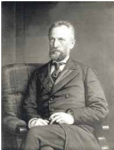
Gróf Károlyi Sándor, a politikus

Fótk: Neogrady László Helytörténelmi Gyűjtemény