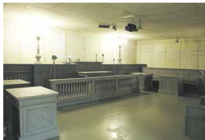
A Fővárosi Bíróság esküdtszéki termének rekonstrukciója

2019 októberében a Terror Háza Múzeum díjmentesen rendelkezésünkre bocsátotta az Egy akaraton 1956—2016 című kiállítását, mely VR (virtuális valóság) szemüvegek segítségével mutatta be a kiállítás anyagát, a forradalom és a szabadságharc pillanatait. A kiállítás szervezésé-