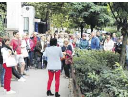
Szeccsziós séta egy pillanata

Élményekben gazdag rendezvényt szervezett „Zsolnay – Épületkerámiák a Schiffer-villában” címmel a Pénzügyőr- és Adózástörténeti Múzeum (PAM) – a Kulturális Örökség Napjai al-