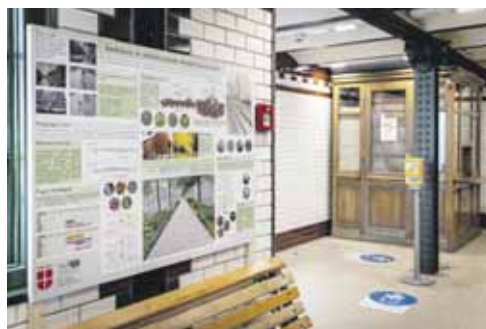
Kertészeti tábló a földalatti állomásának falán

Budapest világörökségi színhelyeinek egyike az Andrássy út. A nyári kánikulában hús árnyat adó fáinak életét veszélyeztető műfüvet a kerület új vezetése 2019-ben felszedette. Sajnos a helyére ültetett élő növények nem éltek túl a nyarat, a gondatlan városlakóknak köszönhetően – rátapostak, ráparkoltak, stb. A fasor területének felújítására a Főkert által készített koncepció magas költségvonzata és a Terézváros jelenlegi anyagi helyzete miatt csak távlati cél lehet. Átmeneti jellegű megoldást kínálnak az egyetemisták által készített javaslatok az Oktogon és a Kodály körönd közötti útszakasz