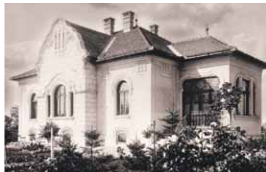
Villákat is tervezett és épített