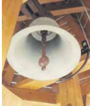
Harangja is behelyezésre került