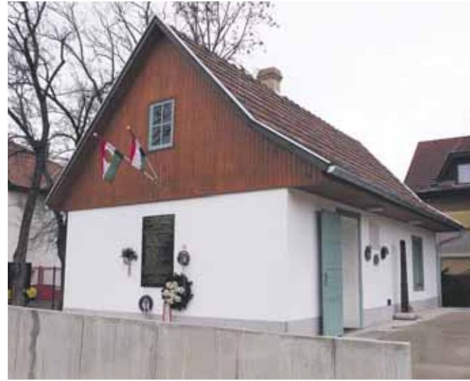
Tóth Ilonka szülőháza – ma emlékház

Az oktató és kiállítóteremben időszaki kiállításokat is tervezünk, többek között 2019-ben itt volt látható Életmódtörténeti kiállítás az ötvenes évekről korabeli tárgyakkal, zászlókkal, fényképekkel, plakátokkal, berendezett fotó laborral, vagy egy