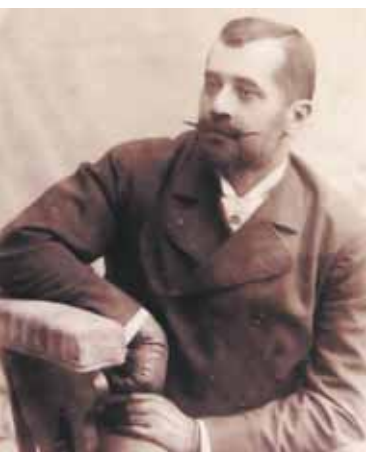
Gróf Károlyi László, a gazdálkodó

Nagykárolyi Károlyi István (Bécs, 1811 - Fót, 1881), városunk alapítója, a reformkori eszmék híve, 1828-ban vette át a főtí uradalom vezetését. Nyugati mintára holland rendszerű tehenészet kialakításával rendezte be majorságát, káposztásmegyéri birtokán is. Az általa 1840-ben szerkesztett haszonbérleti szerződés hozott létre Káposztásmegyerpusztán egy iparos kisközséget. A főtí uradalomhoz tartozó település viszonylagos önállóságot élvezett. A betelepülők közül sokan, maga a földbirtokos hívására helyezték át lakóhelyüket és tevékenységüket ide. (1848-ban a Pest... megyei nemzetőrség parancsnoka. A hazai arisztokraták közül egyedül, saját költségén felállította XVI. Károlyi Huszárezredet – a bukás után bebörtönzik, melyből hatalmas váltságdíj fizetése után szabadulhatott ki – a szerk.)