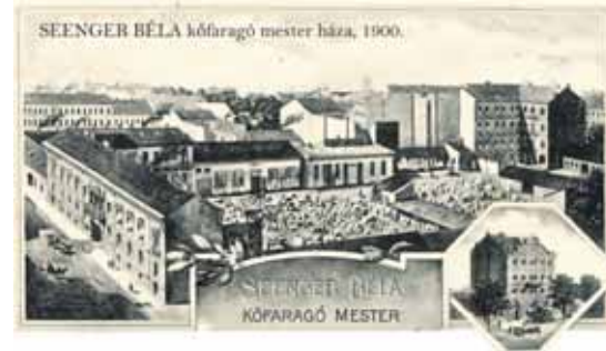
Képeslap az egykori Seenger kőfaragók házáról (1900)

Férje halála után érmészettel kezdett foglalkozni, festői látásmódja különlegesnek számít ebben a hagyományosan szobrászi műfajban. Ráday Mihály városvédő mozgalmához csatlakozva számos könyvet jelentetett meg a Józsefváros elfeledett értékeiről, hozzájárulva a kerület jó hírének újraéledéséhez. Munkásságát a város vezetése „Józsefváros Becsületkeresztje” kitüntetéssel honorálta. Őt követve a Martsa család újabb nemzedékei viszik tovább az elődök emlékét és tartják életben a hely genius loci-ját. A Műteremház előzetes egyeztetés alapján látogatható (web: www.martsamuterem.hu; e-mail: martsamuterem@gmail.com).