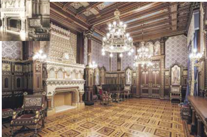
Felül a budavári Királyi Palota Szent István-terme 1903 előtti képeslapon, alul az újjáépített Szent István-terem