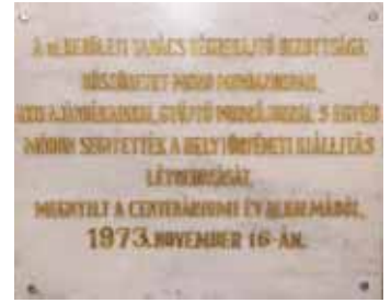
Első kiállításukat emléktábla idézi

Napjainkban az Óbudai Múzeum nemcsak a helyi történeti múlt és kultúra bemutatója és őrzője, hanem több korosztálynak kínál közös találkozási teret, amely a többrétegű tanulás színtere is.