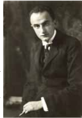
Bárá Hatvany Lajos az 1910-es években

Bajor Gizi színésznőhöz szerelmi szálak fűzték, de a művésznőnek ekkor már vőlegénye volt. Hatvanynak pedig felesége és két törvénytelen gyermeke. Bajor Gizi