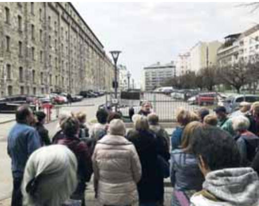
Az egykori Concordia Malom főépületénél (balra) a Vaskapu utcában

L egfontosabb évforduló a 150 éves Budapest egyesítésének dátuma volt a 2023-as évben. A Ferencvárosi Helytörténeti Gyűjtemény többek között tematikus sétákkal emlékezett a jeles eseményre. A vezetett séta mindig különleges élmény a résztvevőknek és a túravezetőknek egyaránt. Akármennyire felkészült is a vezető, akármilyen sokszor ismétli meg ugyanazt a sétát, mindig akad új helyszín, illetve olyan résztvevő, aki új információval egészíti ki az elhangzottakat. A közös felfedezés izgalma így – ha csak két órára is – össze is kovácsolja a sétatársakat. A 2023-as séták között kiemelt szerepet kaptak azok, melyek célzottan a nyugdíjas korosz-