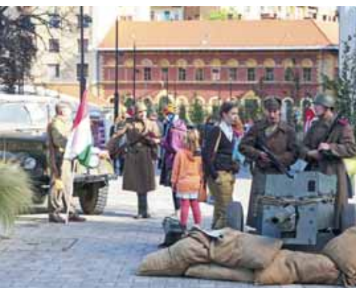
1956 emlékének felidézése a Széna téri emlékparkban

B udapest minden kerületében megemlékeztek október 22-én és 23-án az '56-os forradalomról és szabadságharcról. Ennek egyik emblematikus