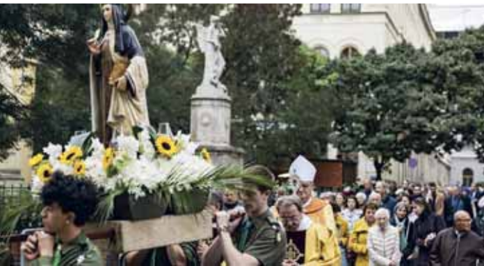
A terézvárosi körmenet október közepén