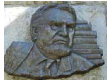
Gyurkovics Tibor emléktáblája lakóháza falán (Mészáros utca 10.)