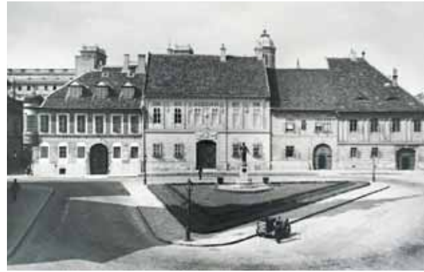
Bécsi kapu tér a Kazinczy-emlékkúttal 1940 körül

A tér többi házai is szépek: 1. számú 1795-ben copf stílusban épült, a 2–4. szá-