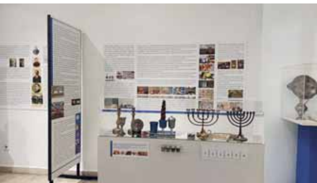
Szöveges és tárgyi anyag a zsidóság ünnepeiről

Nagy segítségünkre volt a kiállítás létrehozásában a Budapesti Zsidó Hitközség Dél-Pesti Körzete, a Centropa, a Holocaust Dokumentációs Központ és Emlékgyűjtemény Közalapítvány, A Magyar Nyelvtérületről Származó Zsidóság Emlékmúzeuma (Cfát, Izrael), Magyar Zsidó Múzeum és Levéltár, United States Holocaust Memorial Museum (Washington, USA), Yad Vashem Intézet (Jeruzsálem, Izrael).