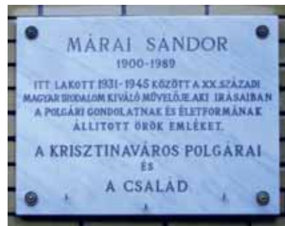
Emléktáblája – I. kerület, Mikó utca 2.

uszt érintette: let: apósa a kassai gettóba került, ahonnan nem sikerült kimenteni, s éle-