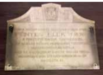
Fényes Elek statisztikus újpesti emléktáblája (lebontott házból)

K omplex történeti anyag a Neogrady László Helytörténeti Gyűjtemény REKO-RETRO című időszaki kiállítása. Újpest-központ területe rekonstrukciójának 50. évfordulója kapcsán idézi fel az emlékeket napjainkig. Kiemelten kezeli az Árpád út két oldalán kialakult panellakótelep építését és a hozzákapcsolódó életforma változást. A kiállított fotó-, dokumentum- és tárgyegyüttes