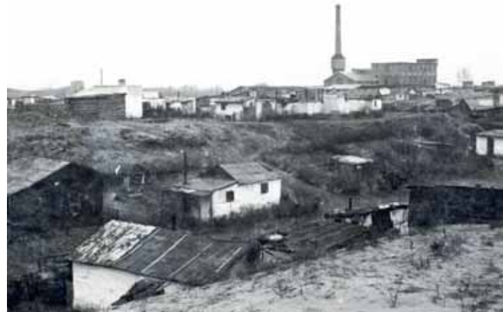
Pesterzsébet Hangya-telepe, háttérben egy gyártelep (1935)

Elkezdték a közmunkák szervezését, a szegényház építését, az utak burkolását, a villanyhálózat fejlesztését, a vízvezeték- és csatornarendszer lefektetését és a közutak kiépítését. Pár év leforgása alatt építettek vágóhidat, ravatalozót, kislakásokat, strandfürdőt, gimnáziumot, új elemi iskolákat, aggok házát, tüdőgondozót. Megszervezték az anya- és csecsemővédelmet, létrehozták a mentőszolgálatot, visszaszorították a tuberkulózis-fer-tőzöttséget.