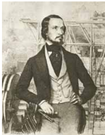
Fotó: OSZK/Barabás Miklós

A híd teljes szerkezetét 1914-től két év alatt teljesen átépítették, mert a megnövekedett forgalmat a szerkezet már nem bírta. A faelemeket acélgerendákra cserélték, és a láncok is hosszabbak lettek. Budapest ostromakor 1944-ben a németek fölrobbantották a hidat, de a láncok 70%-át az újjáépítéskor meg tudták menteni. Felújítása az eredeti átadás centenáriuma, 1949-re készült el, majd 1973-ra, Budapest egyesítésének százéves évfordulójára ismét elvégezték a szükséges nagyjavítását. A 2021-ben történt újabb felújítás óta a Lánchíd ismét régi pompájában feszül a Duna felett, a személyautó-forgalmat azonban kitiltották róla.