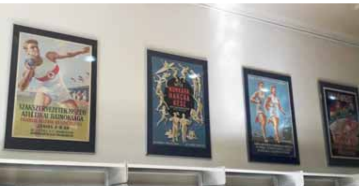
Sport plakátok a gyűjtemény gazdag anyagából

Szerénységükre jellemző, hogy időszakos tárlataiknak nincs meghívója és megnyitója, nincs szórólapja, nincs online ismertetése, és a közösségi oldalakon sem találkozunk hirdetéseikkel. Az olvasóik által használható két könyvtári terület elválasztó vitrinekben és a falakon helyezik el időszakos tárlataik anyagait. Szeptemberben arra járva a budapesti sporttevékenységek kiállított relikviáival találkoztunk.