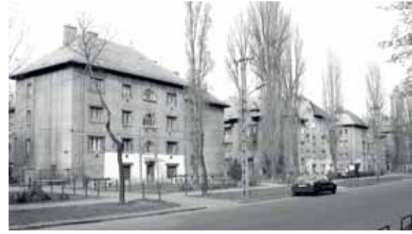
A MÁV-lakótelep Gyáli úti házsora 2010-ben

1910 körül a Gyáli út felőli oldalon álló hat épületet lebontották, helyükre négy-szintes, téglaborításos, modernnek számító lakóházakat építettek, ezeket 1930 körül még tovább alakították, ekkor nyerték el mai formájukat. A telep tehát két jól elkülöníthető részre osztható épületegyüttesből áll, közepén egy különleges építménnyel - a kolóniának külön víztornyot szolgáltatva a folyóvizet. Az épület mellett még két lakóházat emeltek 1932-ben. A MÁV 1987-ben a