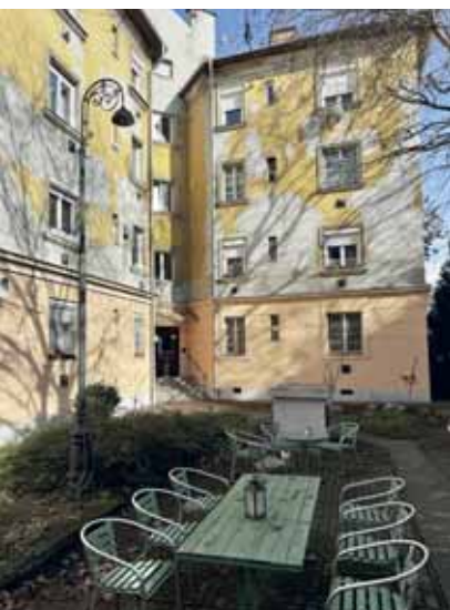
X. kerületi Maglódi út 10. alatti tömb belső udvara napjainkban

közöttük kertszerű terek alakuljanak ki. Ma ezek az ott élők értékes magánparkjai, érdemes ez ügyben körülnézni például Óbudán a Raktár utca környékén.