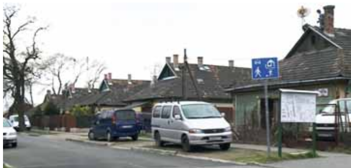
Az Aszódi-telep napjainkban

a városközpontba jutás így is hosszú időt igényelt. Néhány kezdeményezés az elszigeteltség érzését biztosan enyhítette (1958-tól működött saját élelmiszerbolt, 1964-ben a Fővárosi Szabó Ervin Könyvtár nyitott fiókot, 1980-ban az egyik megüresedett lakásban idősek klubja nyílt), de a szorosan egymás mellett kialakított, kis alapterületű lakások a hozzájuk kapcsolódó aprócska előkertekkel inkább a továbbköltözésre, mintsem a maradásra ösztönözték az itt élők nagy részét.