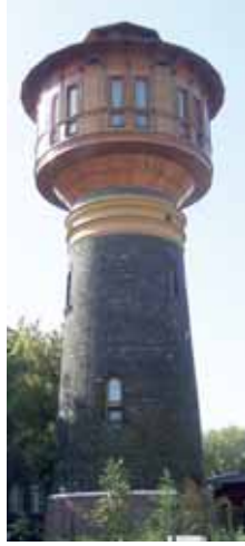
A MÁV-lakótelep felújított víztornya, ma magánlakás

Több lakótelepet építettett alkalmazottai számára a fővárosban a 19–20. század fordulóján a Magyar Királyi Államvasutak, elsősorban olyan területeken, amelyek az akkori főváros peremvidékének számítottak, de földrajzilag közel estek pályaudvarokhoz. Épült lakótelep a Hungária körút - Salgótarjáni út sarkán, Rákospalotán, de a Kéleti és a Nyugati Pályaudvarok szomszédságában is. A IX. kerületben az ország egyik legnagyobb alapterületű rendezőpályaudvara mellett, a Gyáli út, Péceli út, Szerelvény köz és Zombori utca által határolt területen 1895-re épült ki munkáskolónia. A nagyjából hat hektáros területen eredetileg 31