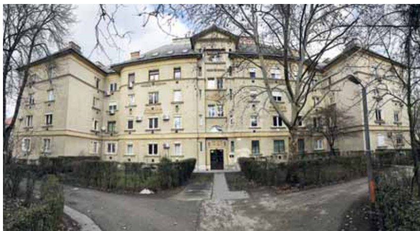
Bérházcsoport, III. kerület, Raktár u. 39-41.

A program keretében egy- és kétemeletes pavilonokból álló szükséglakás-telepeket is építettek a Ceglédi és a Jászberényi úton. A felszámolt bódévárosokból érkezők itt 20 négyzetméteres lakókonyhában húzhatták meg magukat, ahol a víz, villany, sparherd és gázrezsó, valamint az épületek két végén egy-egy klozetcsoport jelentette a megfizethető komfortot. Az új lakó-