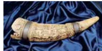
A jászberényi múzeumban őrzött jászkürt

részére szervezett történelmi vetélkedő, hagyományörző rendezvények – kórustalálkozók, szüreti felvonulások, népi gyermekjátékok vetélkedője egyaránt szerepel a színes palettán. Fő rendezvényként kiemelkedik az évente más-más jász településen megrendezett Jász Világtalálkozó, melynek társrendezője a Jászok Egyesülete. A kulturális seregszemle az elszármazott, kirajzott és otthon élő jászok számára jelent találkozási lehetőséget évről évre.