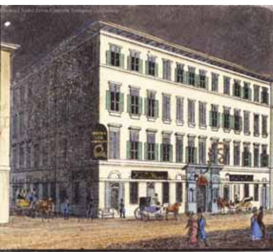
A vadászkürt vendégfogadó a kis-hidútszabán. Hotel zum Jägerhorn in der kleinen Bruckgasse.

Pesttel Deák Ferenc az 1820-as évek elején ismerkedett meg, ami maradandó élményt nyújtott számára. Miután 1822 novemberétől egy éven át volt jurátus a városban, 1823. december 19-én sikeres vizsgát tett a mai Ferenciek terén állt egykori Királyi Curia épületében, melynek helyét ma már csak az épü-