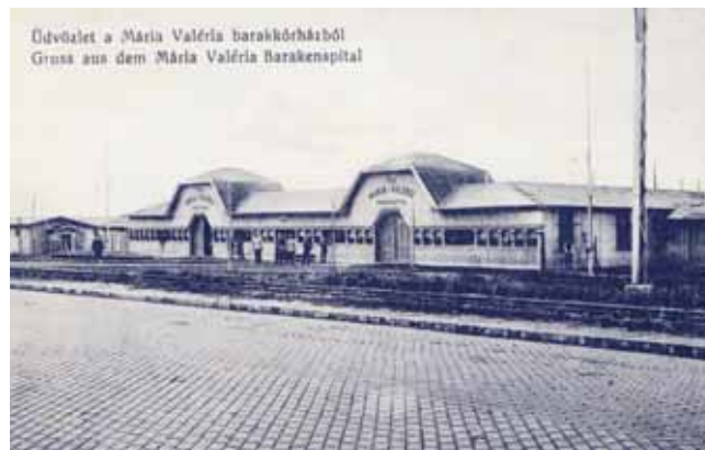
Üdvözet a Mária Valéria barakkkórházból Gruss aus dem Mária Valéria Barakkenospital

Budapest egyik legegységibb városrészének története meglehetősen változatos, és e történetnek mindig akad egy olyan fejezete, melyet érdemes felidézni. A mai Ecséri út, Üllői út, Határ út és Gyáli út által határolt területet az 1860-as években katonai gyakorlóterként jelezték a korabeli térképeken, de egyes részeit sertéslegelőként is használták. Ebben az időben két természetes tó is húzódtott itt, melyek itatásra voltak hivatva, neveik használatukat is elárulták: Nagy Sertés tó és Kis Sertés tó. A 19. század végére a tavakat feltöltötték, a közeli laktanyák ezredei számára lőtérként és felvonulási területként szolgált az első világháború kitöréséig az Üllői út e része. 1914 őszétől a frontról egyre nagyobb számban érkeztek sebesültek Budapestre, ellátásukra a fővárosban több helyen is hadikórházakat létesítettek. Az egyik legnagyobb alapterületű, Mária Valéria főhercegnő nevét viselő intézmény a gyakorlóterületén már ez év végén megnyílt. 1916-ra a kórháztelepen 120 barakkot létesítettek, a telep másfél kilométer hosszúságú és ötszáz