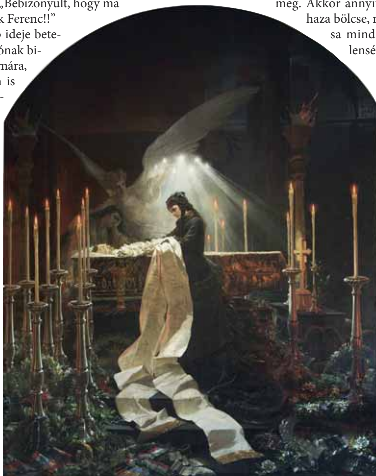
Erzsébet királyné Deák Ferenc ravatalánál – Zichy Mihály festménye, 1877

négy festménye Székely Bertalan alkotása. Bő tíz esztendővel a halála után foglalhatta el végső nyughelyét Deák Ferenc, mauzóleumát 1887. május 21-én avatták fel.