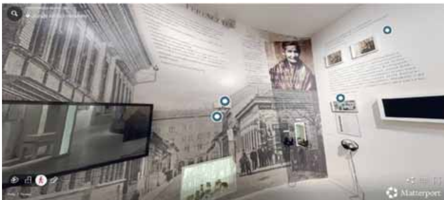
3D-s virtuális séta a József Attila Emlékhely weblapján

A modern élménykiállítás 2015-ben jött létre